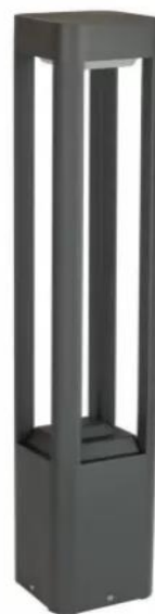
FAN KWADRAT FKW-800