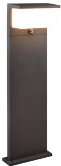
Trio Nestos 440969142