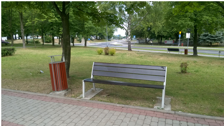
ISTNIEJĄCE ŁAWKA I KOSZ PRZEZNACZONE DO PRZENIESIENIA.

Jedna z ławek wraz z sąsiadującym koszem zostanie przeniesiona z rejonu istniejącego chodnika na projektowany plac, gdyż w obecnym stanie kolidowałyby z inwestycją.