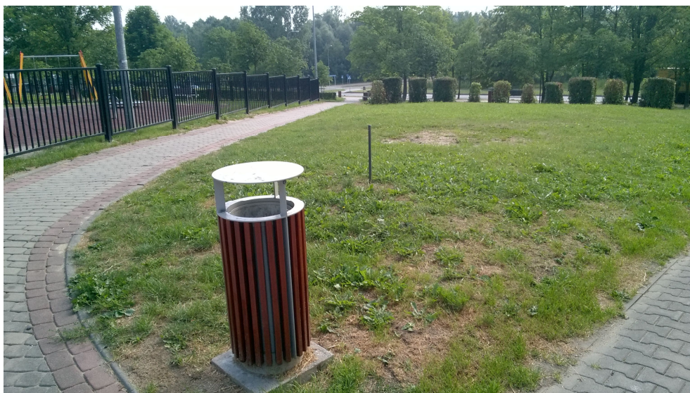
TEREN KOŁO PLACU ZABAW – LOKALIZACJA MNIEJSZEGO Z PROJEKTOWANYCH UTWARDZEN.

Parcela numer 382 położona jest w kwartale ulic: Warszawskiej, Poznańskiej i Wrocławskiej w Jastrzębiu – Zdroju. Całość terenu poprzecinana jest licznymi ciągami pieszymi, wzdłuż których ustawione są ławki. W centralnej części działki została urządzona siłownia plenerowa, a w południowym narożniku – ogrodzony plac zabaw dla dzieci.