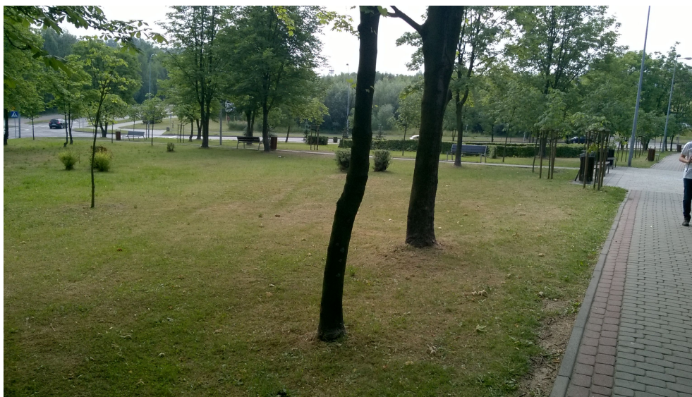
TEREN KOŁO SIŁOWNI – LOKALIZACJA WIĘKSZEGO Z PROJEKTOWANYCH UTWARDZEN (w tle widoczna ul. Warszawska).