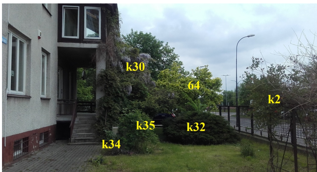
Ryc. 4. Drzewo nr 64 i krzew k30, od min. trzech dekad tworzą charakter hortologiczny posesji w tej części pierzei ul. Warszawskiej.

Na tym terenie tzw. „przedogródka” w sekcji południowej przy ogrodzeniu od strony ul. Warszawskiej, znajdują się Wisteria sinensis /Glicynia chińska i Magnolia x soluangeana /Magnolia pośrednia (Ryc. 4)