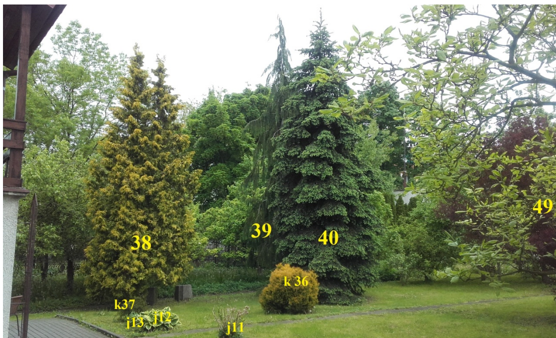
Ryc. 3. Dominujące drzewa ozdobne sekcji środkowej-północnej nr 38,39,40,49.

Powyższej grupie drzew towarzyszą znajdujące się poza domem od strony północnej, również znajdujące się w strefie zagrożenia Cupressus nootkatensis /Cyprys nutkajski i Thuja plicata /żywotnik zachodni Olbrzymi, oraz Magnolia x soluanegana /Magnolia pośrednia (Ryc. 3).