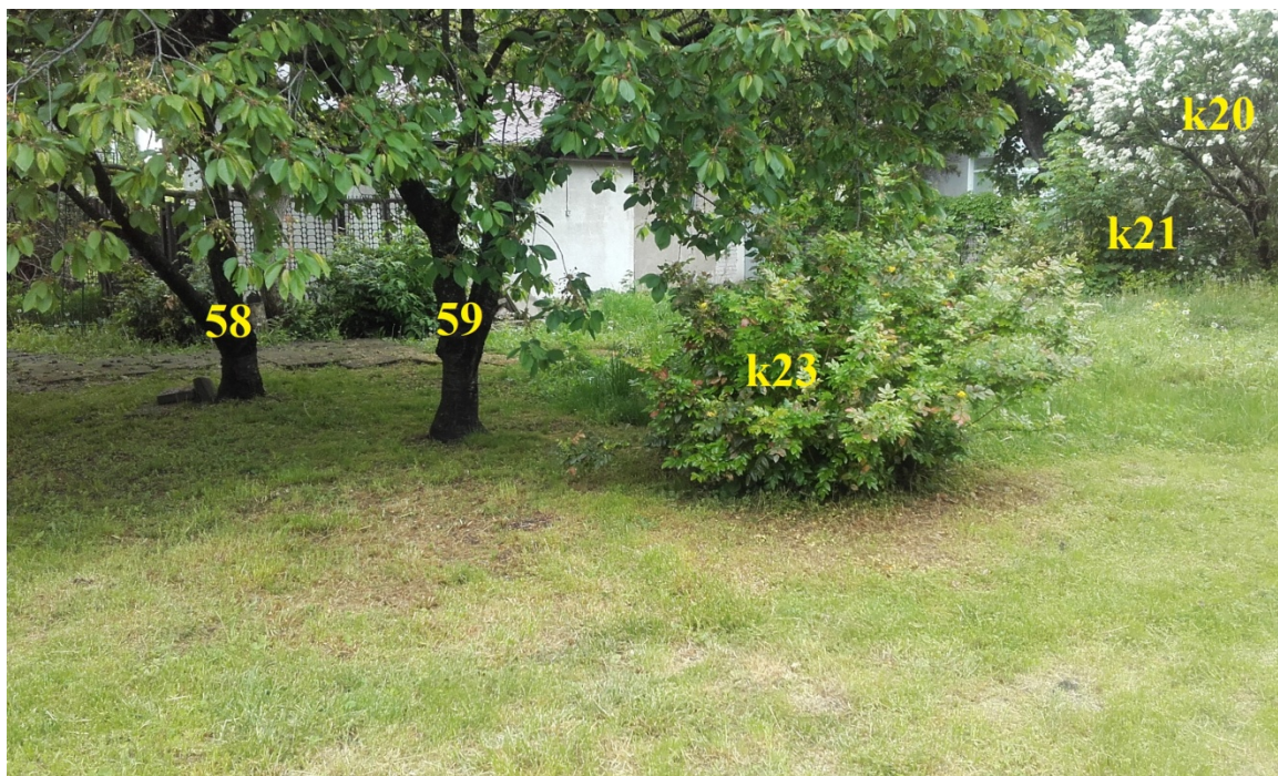
Ryc. 6. Drzewa 58, 59 i krzewy k20, k21, k23 w cz. północnej sekcji wschodniej.