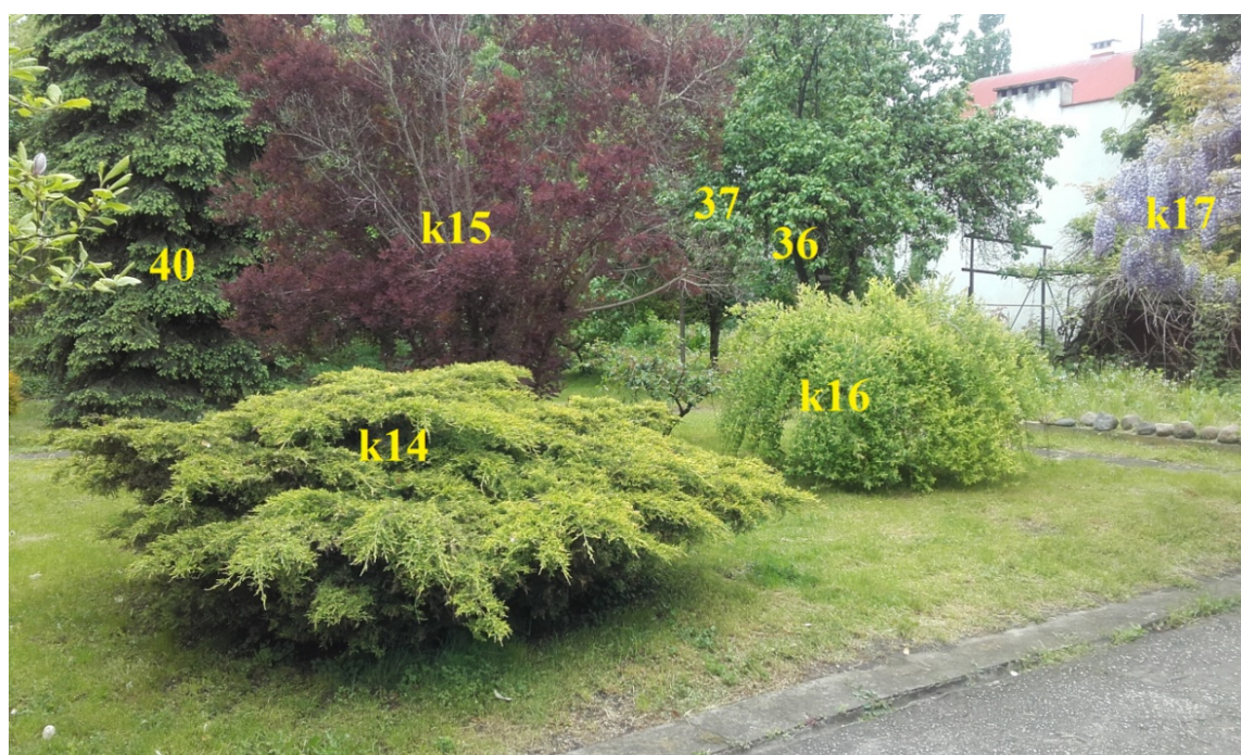
Ryc. 5. Krzewy w sekcji środkowej –północnej.

Są to rośliny o szczególnym znaczeniu walorowym (Ryc. 2, 3, 4) dla percepcji krajobrazowej w samym lokowaniu posesji w tej części ul. Warszawskiej, wpisujące się w kilkudziesięcioletni charakter tego miejsca, (które winny być zachowane i nie podlegają fizycznemu usunięciu (patrz Operat dendrologiczny i Plan Ochrony Zieleni).