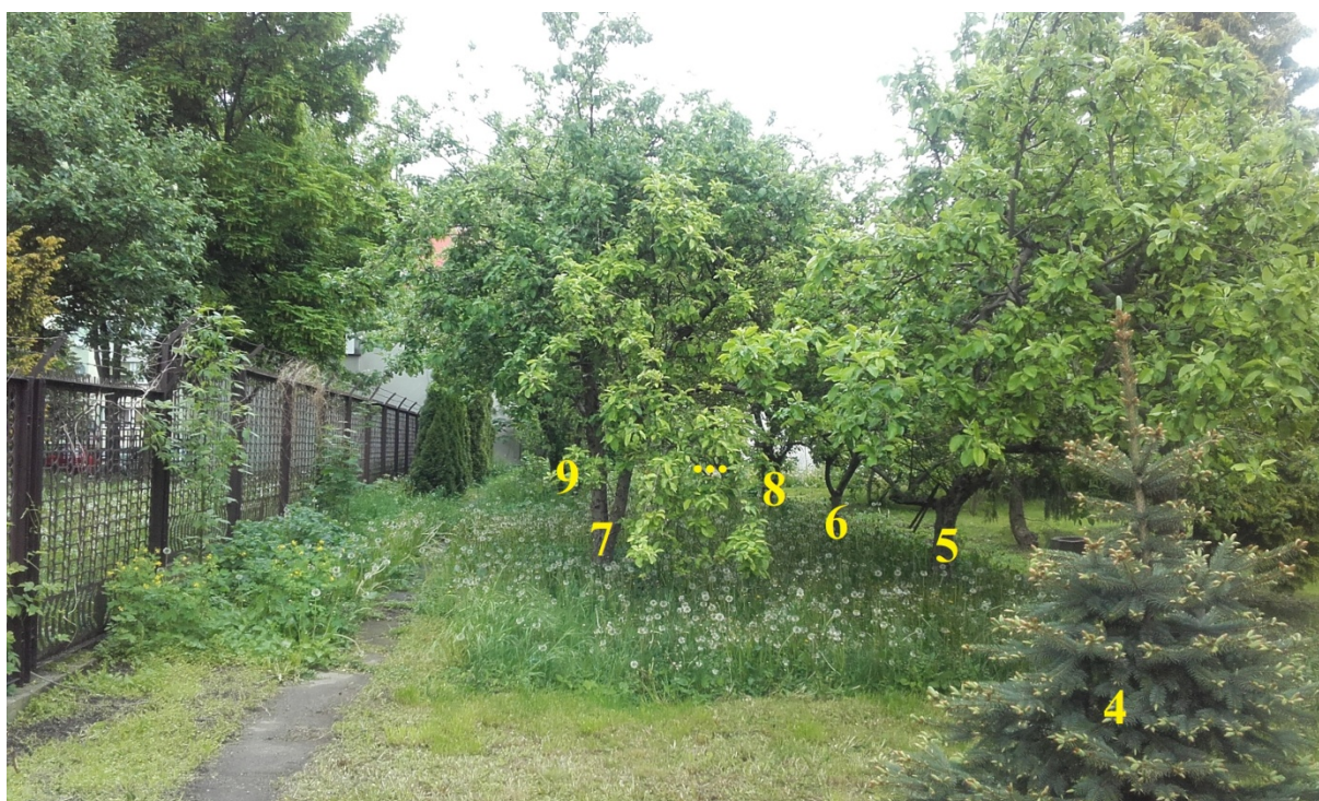
Ryc. 1. Drzewa owocowe nr 5,6,7,8,9,10,11,12, 13, 36,37 w sekcji zachodniej, w szpalerze przy ścieżce prowadzącej od domu. (fot. S. Markowski)

W nich najbardziej zauważalnymi są dwa szpalery drzew owocowych. Pierwszy, w sekcji zachodniej, przy domu od strony zachodniej Malus domestica /Jabłoń domowa i Prunus domestica /Śliwa zwykła. Drugi szpaler, w sekcji wschodniej domu, także złożony z Malus domestica /Jabłoń domowa i Prunus domestica /Śliwa zwykła, rozdziela część północno-zachodnią ogrodu od prostokątnego gazonu po stronie wschodniej. Wobec projektowanych działań budowlanych związanych z adaptacją, pracami termoizolacyjnymi budynku i przebudową drogi wewnętrznej, drzewa te w bezpośredni sposób znajdują się w przestrzeni zagrożenia projektowanymi działaniami budowlanymi (Ryc.1 i 2).