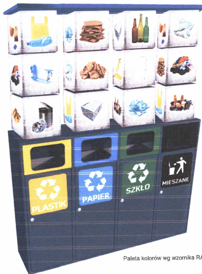
Paleta kolorów wg wzornika RAL