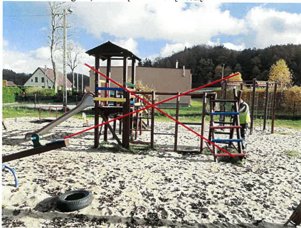
Urządzenie przeznaczone do rozbiórki

W ramach inwestycji należy zdemontować i zutylizować istniejące drewniane urządzenie zabawowe ze ślizgiem, drabinką i zadaszoną wieżą.