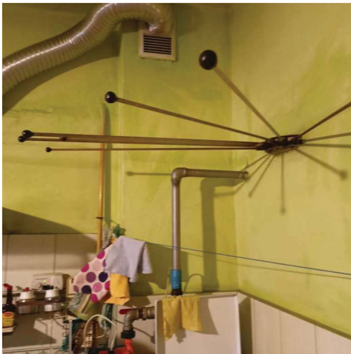
Rysunek 1 Zakres modernizacji - montaż nowego źródła ciepła (kocioł gazowy dwufunkcyjny)