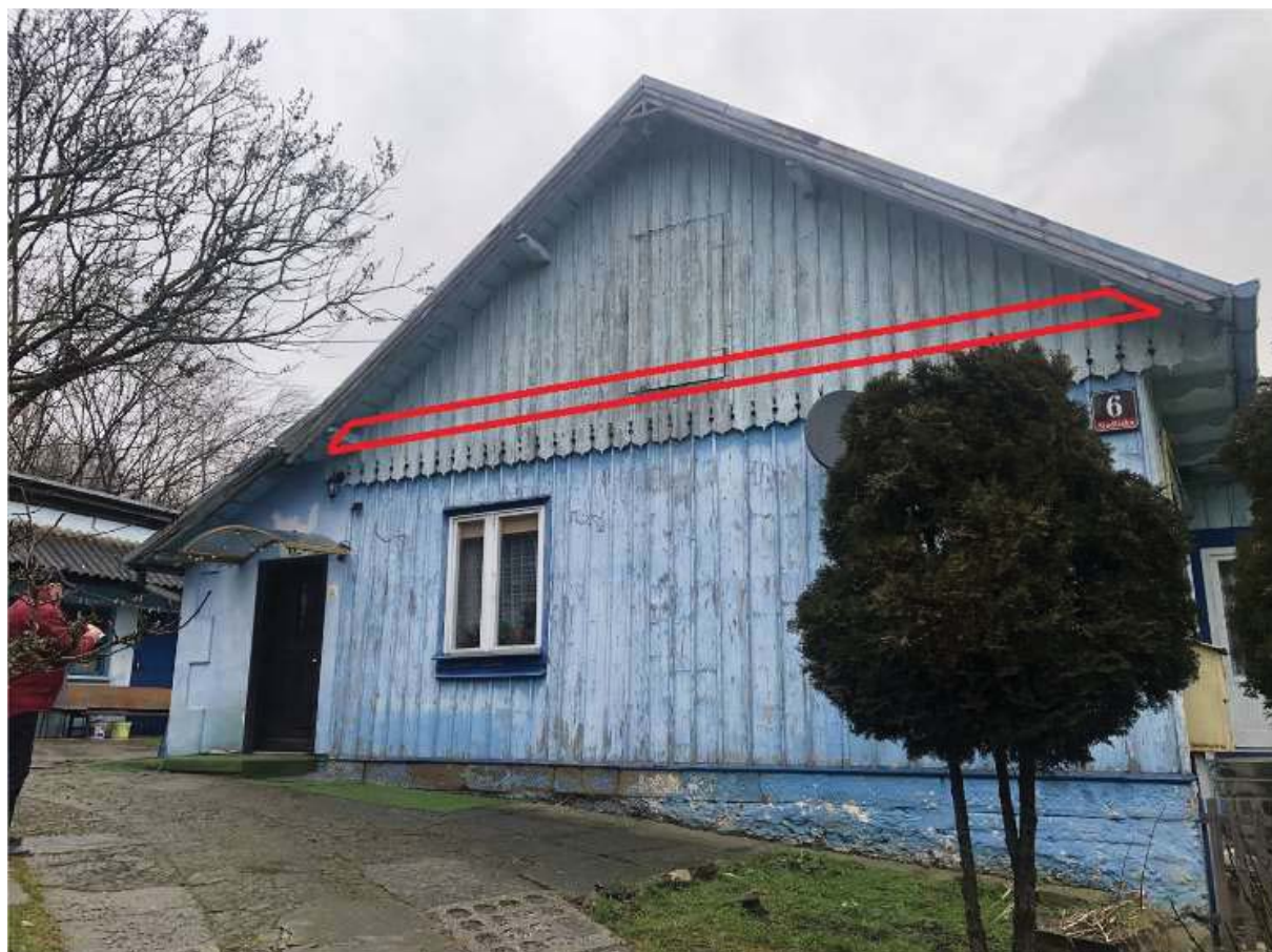
Rysunek 3 Zakres modernizacji - docieplenie stropu