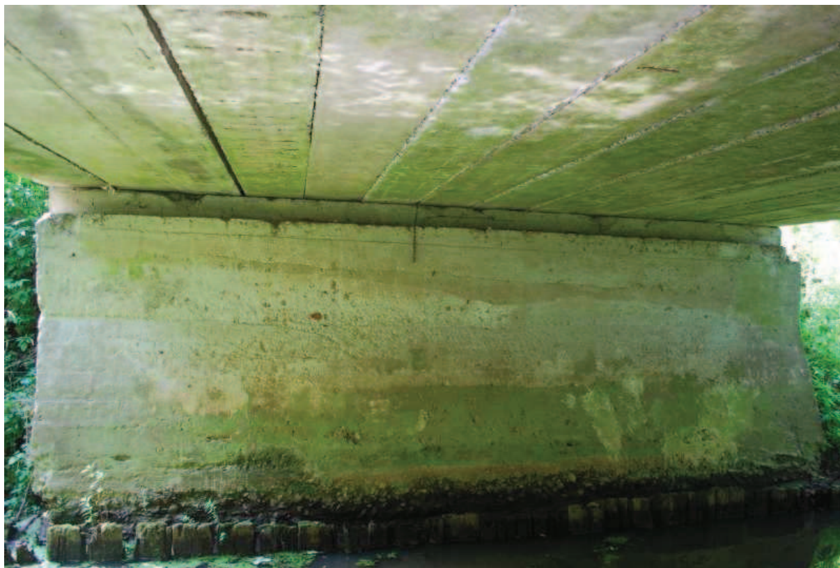
Fot. 7. Widok na przyczółek wschodni. Widoczne ubytki betonu w dolnej części korpusu.