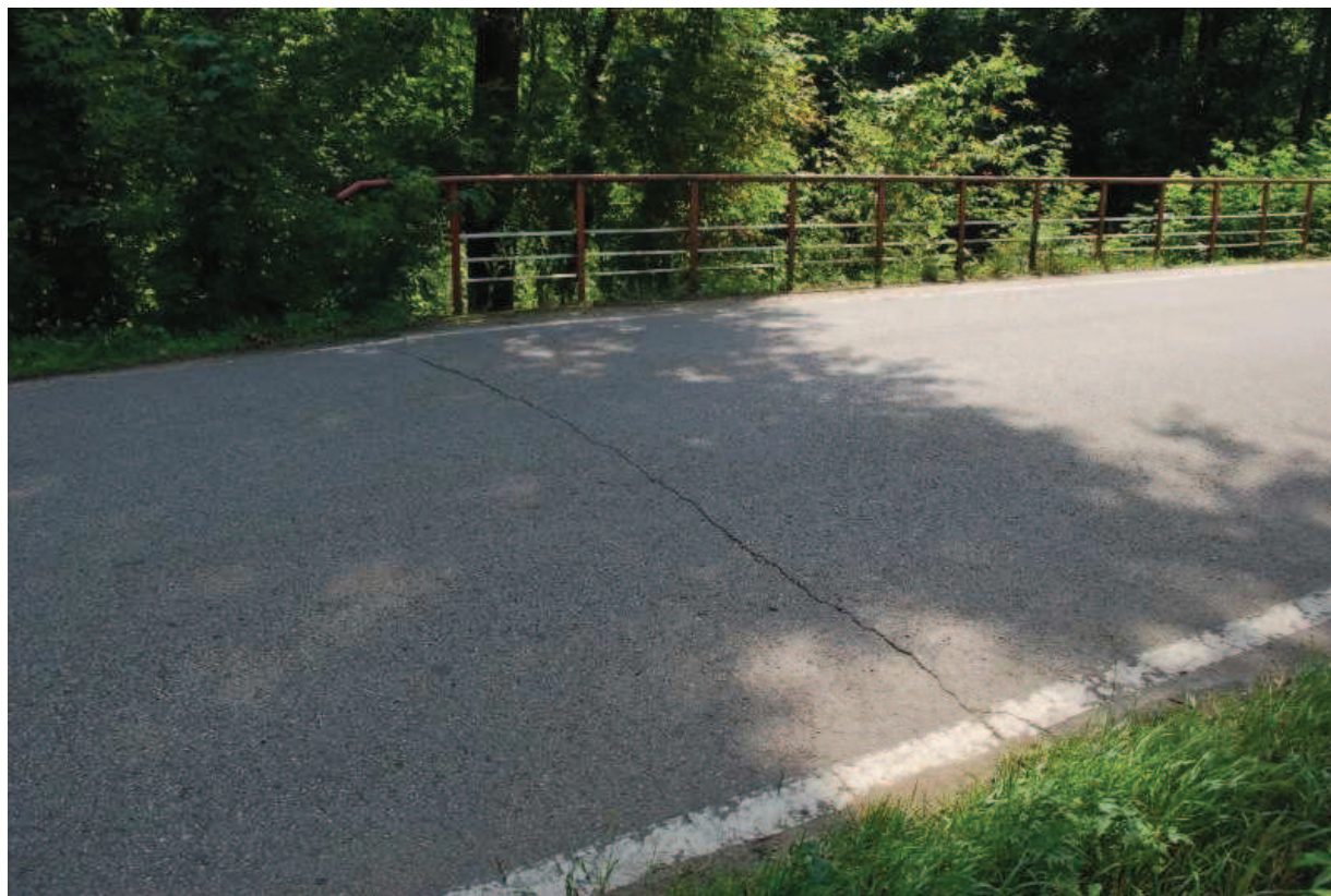
Fot. 13. Widok na strefę dylatacji po stronie zachodniej. Widoczne rysy nawierzchni asfaltowej.