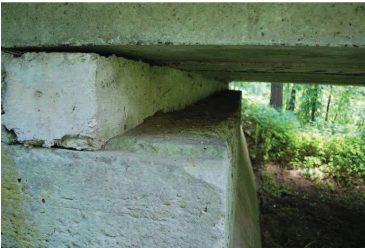
Fot. 10. Widok na ławę podłożyskową przyczółka zachodniego. Widoczne zanieczyszczenia ławy wskazują na brak systematycznych prac utrzymaniowych.