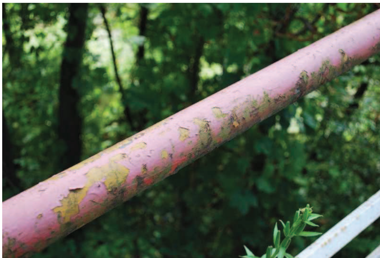
Fot. 14. Widok na pochwyt balustrady północnej. Widoczne ubytki zabezpieczenia antykorozyjnego oraz zanieczyszczenia spowodowane brakiem systematycznych prac utrzymaniowych.