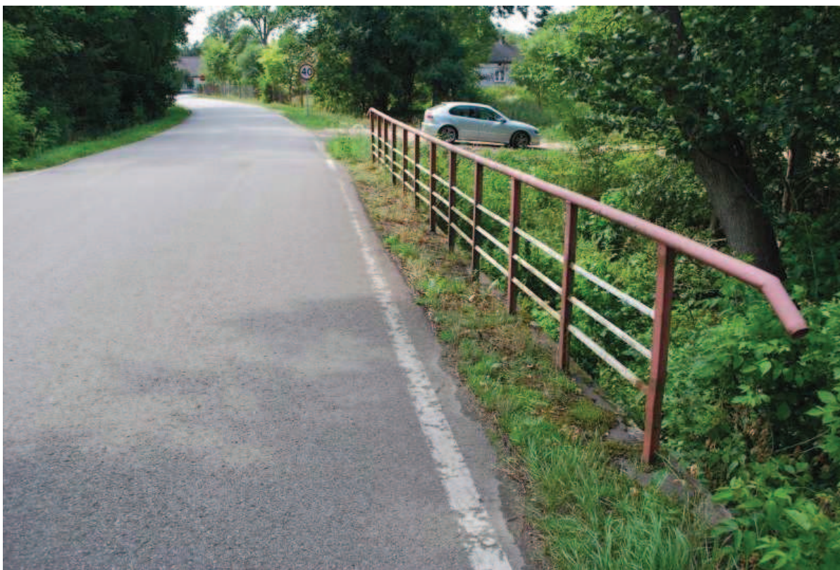
Fot. 12. Widok na południową kapę obiektu. Widoczne intensywna wegetacją spowodowane brakiem systematycznych prac utrzymaniowych.