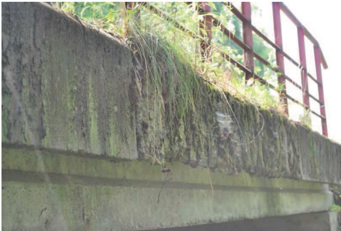
Fot. 5. Widok na gzyms kapy południowej. Widoczna korozja i ubytki betonu oraz korozja stali zbrojeniowej. Przyczyną degradacji są nagromadzone zanieczyszczenia na kapie (brak systematycznych prac utrzymaniowych) co skutkuje stałym utrzymywaniem wilgoci oraz wystąpieniem wegetacji roślinności.