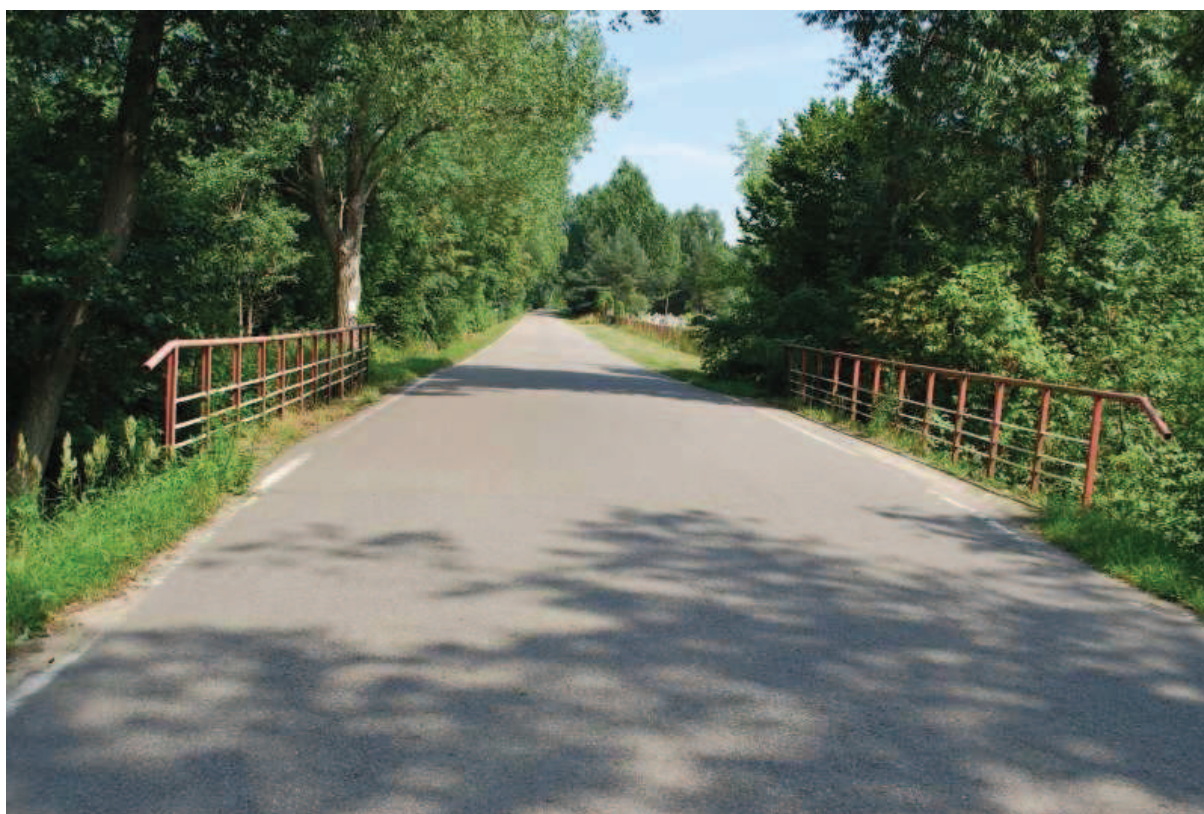
Fot. 2. Widok od strony wschodniej.