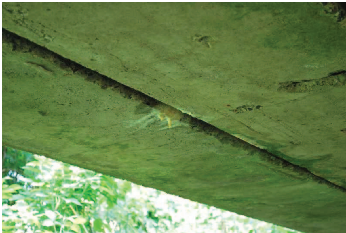
Fot. 9. Widok na szczelinę pomiędzy pierwszą, a drugą belką od strony południowej. Widoczne zacieki i osady wskazują na miejscową nieszczelność izolacji pomostu.