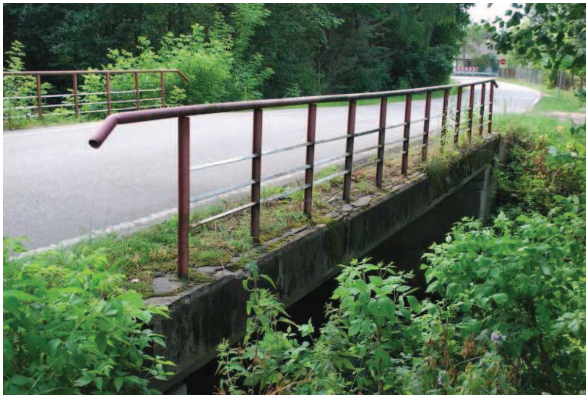
Fot. 1. Widok od strony południowo - zachodniej.