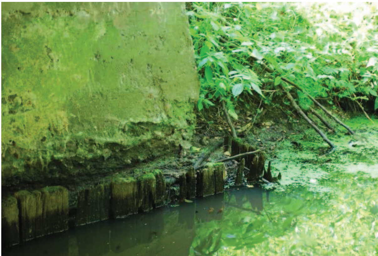
Fot. 8. Widok na przyczółek wschodni po stronie południowej. Widoczne ubytki betonu.