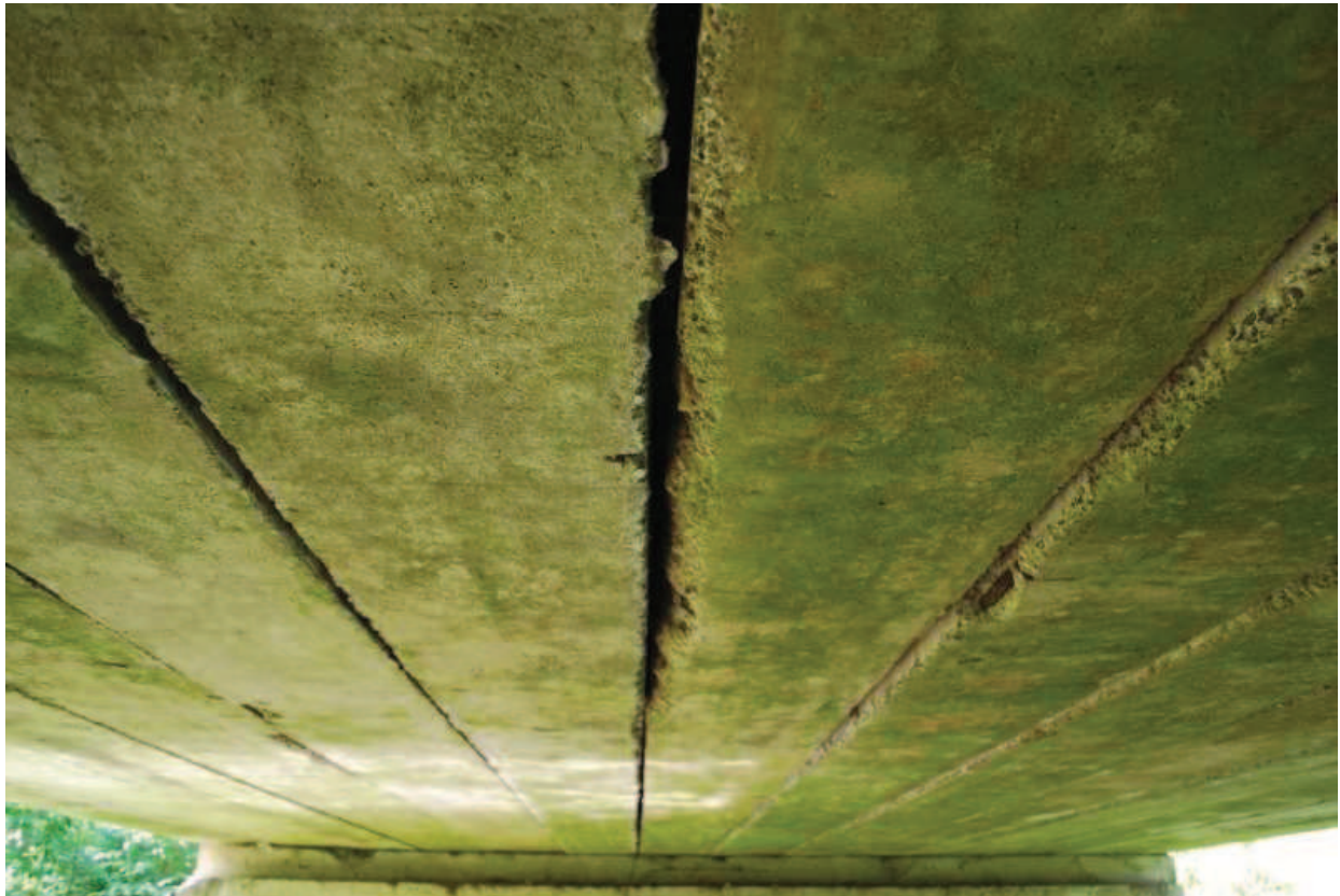
Fot. 3. Widok na od spodu na konstrukcję nośną obiektu.