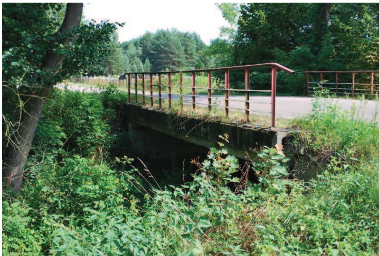
Widok ogólny mostu