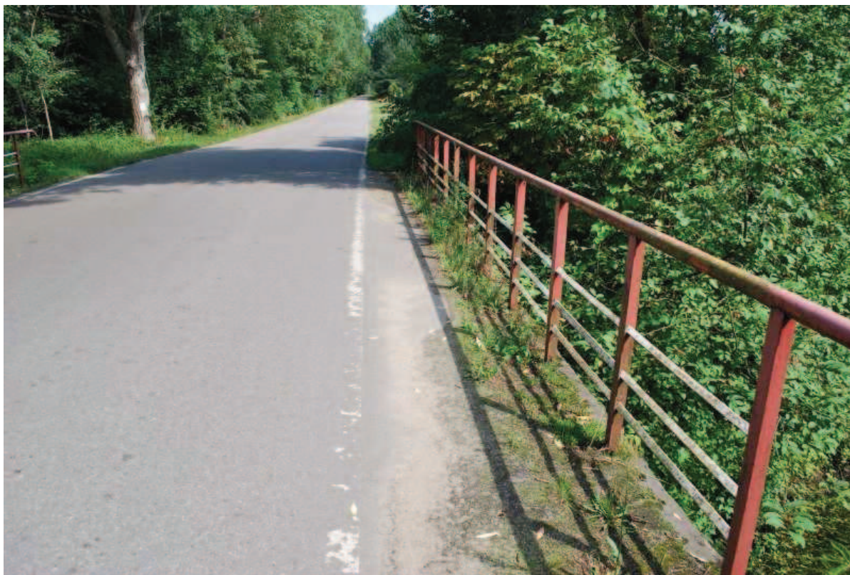
Fot. 11. Widok na północną kapę obiektu. Widoczne intensywna wegetacją spowodowane brakiem systematycznych prac utrzymaniowych.