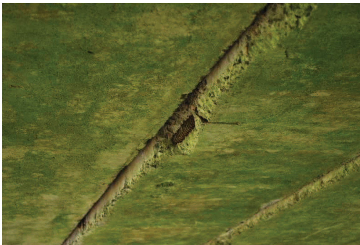
Fot. 6. Widok na belki ustroju nośnego. Widoczne ubytki betonu oraz korozja stali zbrojeniowej.