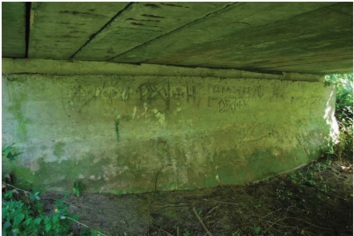
Fot. 4. Widok na przyczółek zachodni.