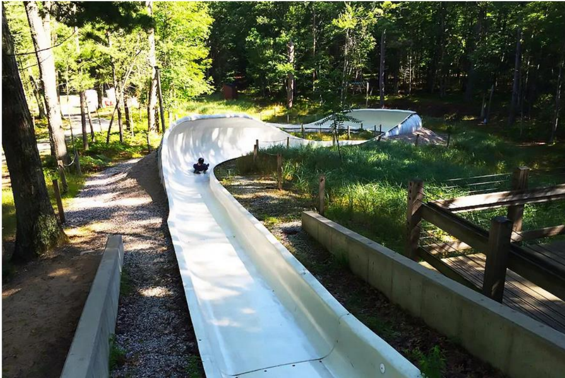
Widok ogólny na 1 i 2 wiraż

Nieckę należy wykonać z powtarzalnych segmentów z tworzywa sztucznego kompozytowego odpowiednio wyprofilowanych umożliwiających bezpieczny zjazd rekreacyjny, jak i wyczynowy.