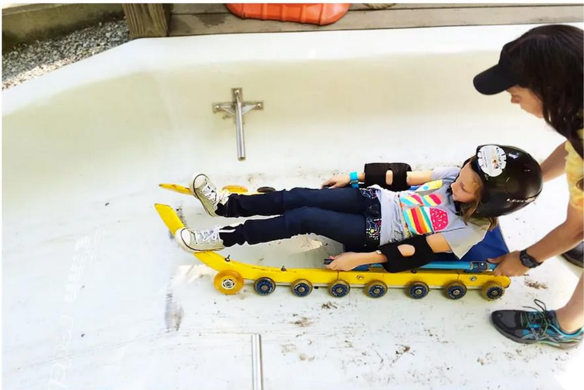
Rejon startu kobiet na torze w Muskegon