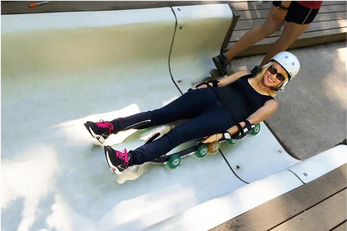
Rejon startu kobiet na torze w Muskegon