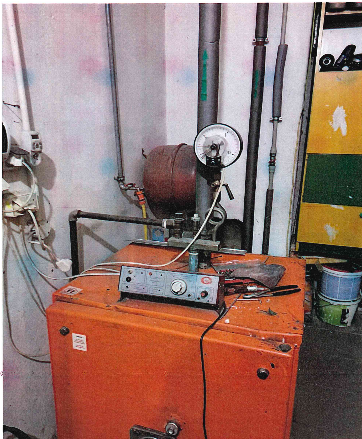
Istniejący kocioł olejowy

„Przebudowa systemu grzewczego w obiekcie użyteczności publicznej Świetlicy Wiejskiej w Grucznie z zastosowaniem odnawialnych źródeł energii – zakup i instalacja gruntowej pompy ciepła”