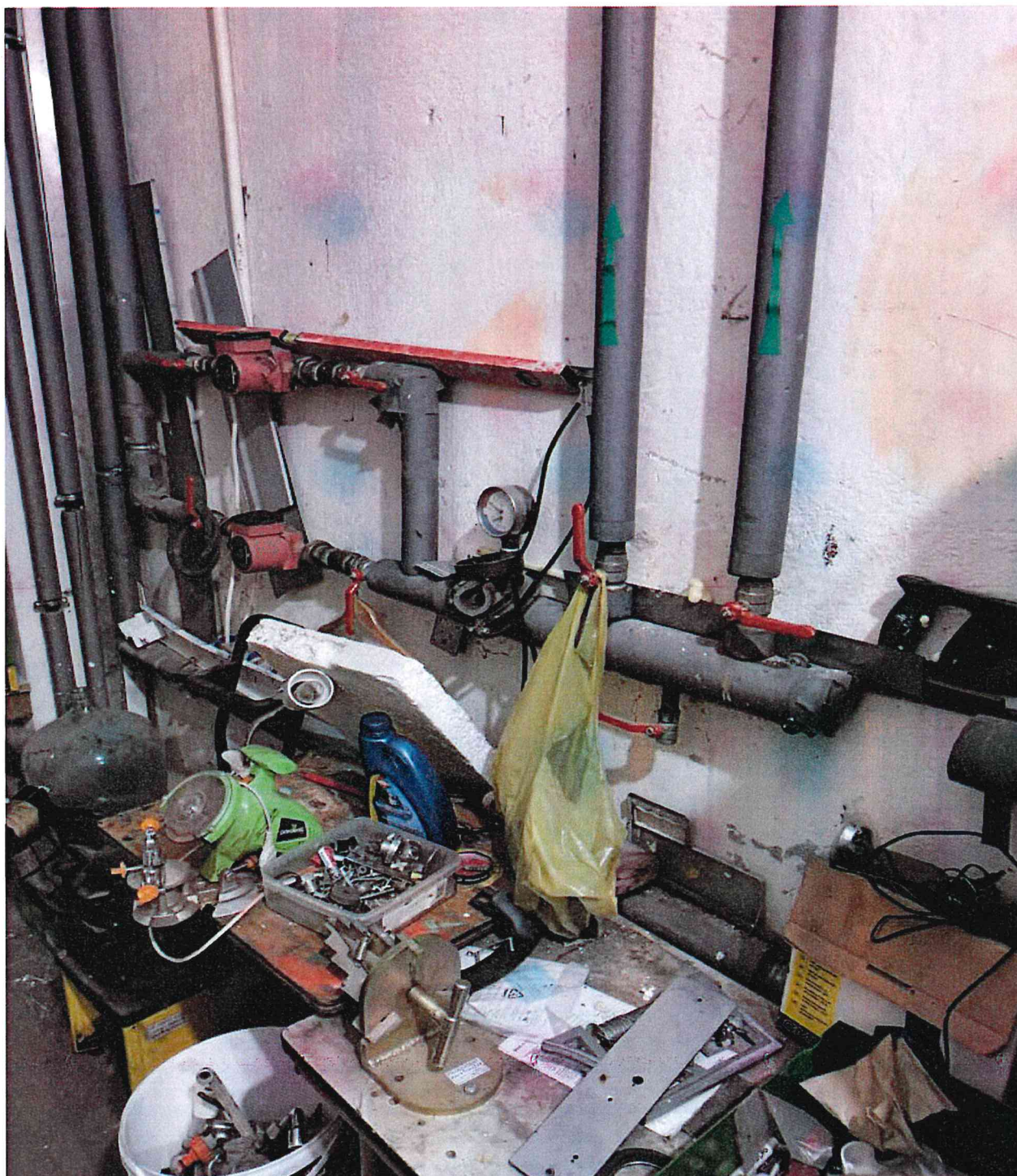
Fragment instalacji grzewczych

„Przebudowa systemu grzewczego w obiekcie użyteczności publicznej Świetlicy Wiejskiej w Grucznie z zastosowaniem odnawialnych źródeł energii – zakup i instalacja gruntowej pompy ciepła”