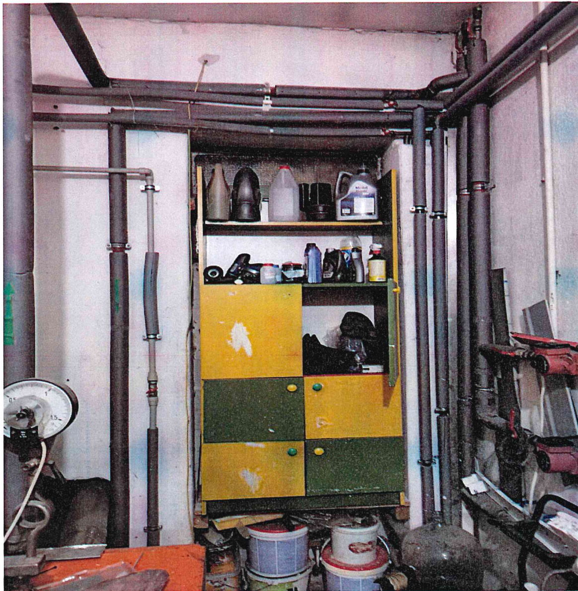
Potencjalna lokalizacja bufora ciepła

„Przebudowa systemu grzewczego w obiekcie użyteczności publicznej Świetlicy Wiejskiej w Grucznie z zastosowaniem odnawialnych źródeł energii – zakup i instalacja gruntowej pompy ciepła”