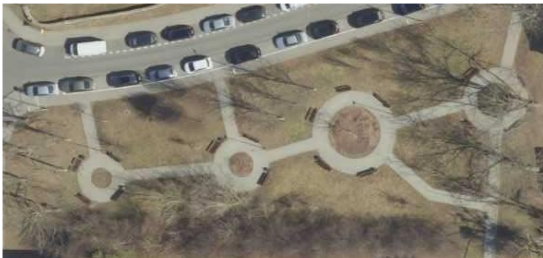
VIIIa. Park przy ul. Zwycięstwa i Dambonia 3 w Opolu