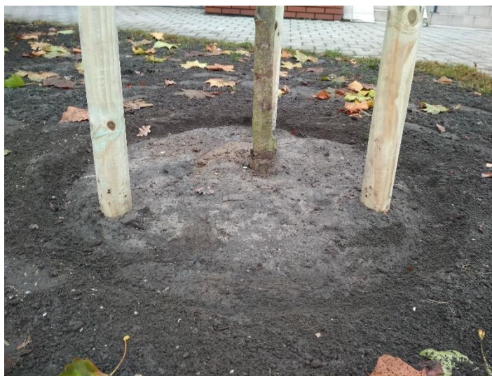
Ryc. 1 - Przykładowa misa do podlewania drzew.