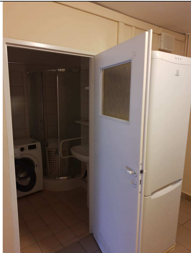
Zdjęcie nr 9 – widok łazienki jednego z segmentów