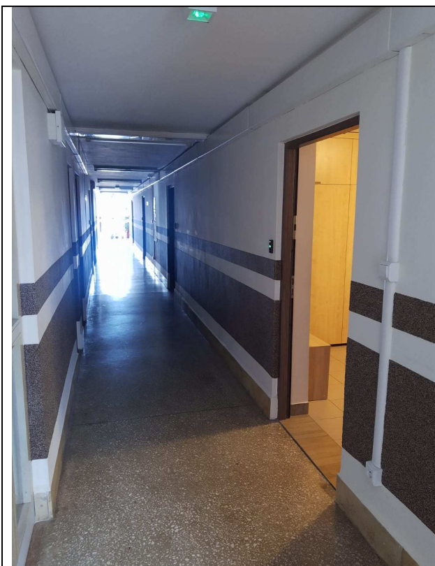
Zdjęcie nr 3 – korytarz jednego z skrzydeł budynku