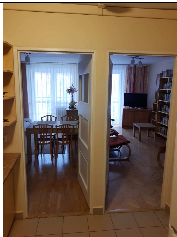
Zdjęcie nr 5 – widok pokoi z przedpokoiu jednego z segmentów