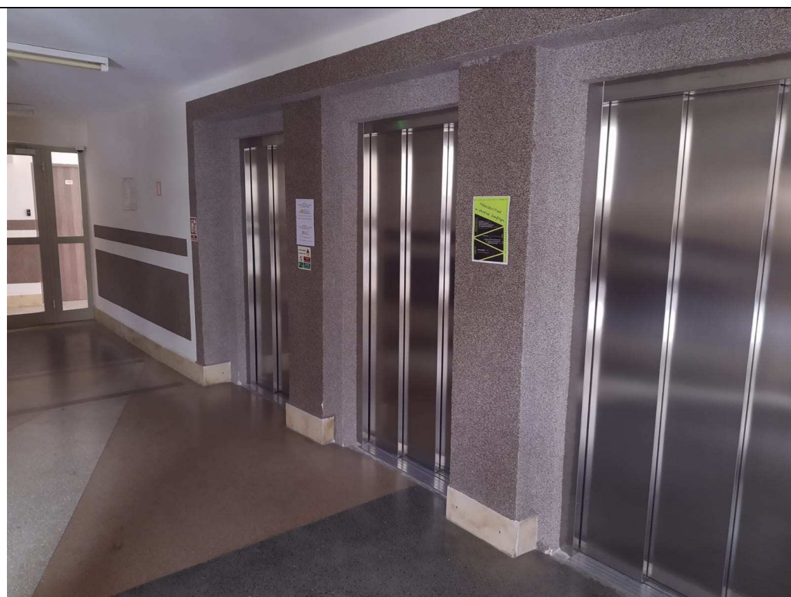
Zdjęcie nr 2 – Hol przed windami