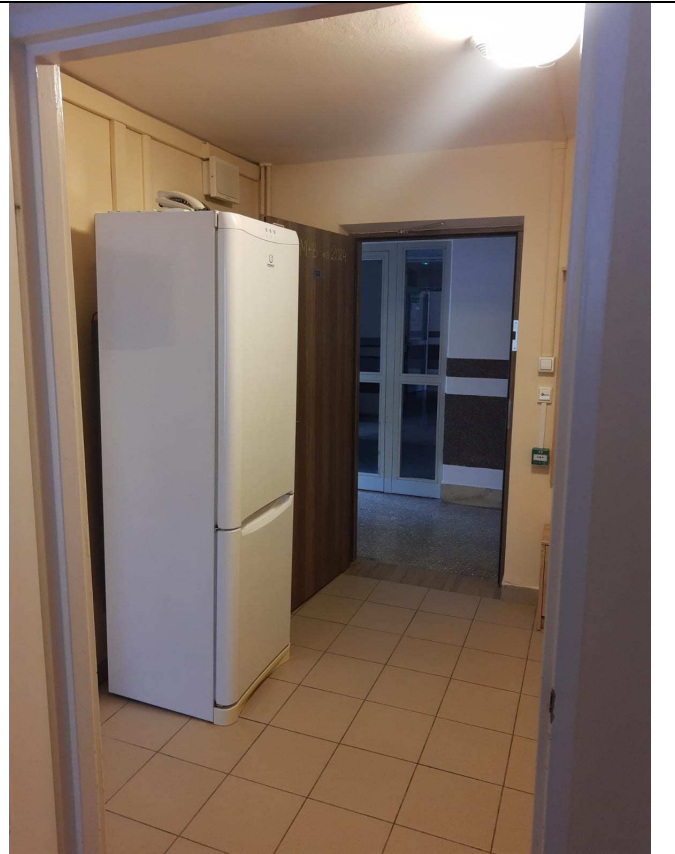
Zdjęcie nr 8 – widok przedpokoju jednego z segmentów