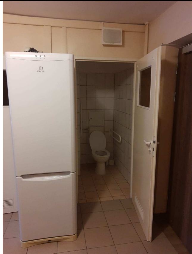
Zdjęcie nr 7 – widok łazienki jednego z segmentów