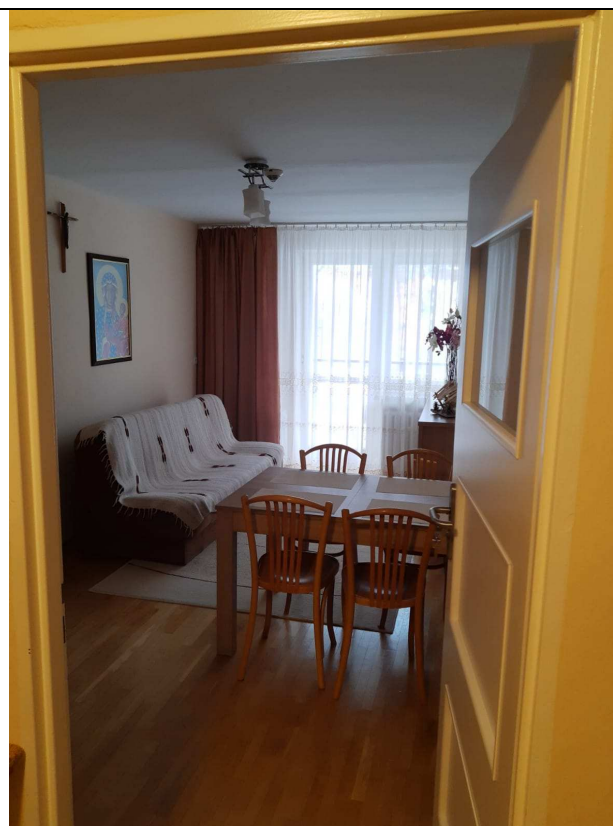
Zdjęcie nr 6 – widok pokoju jednego z segmentów