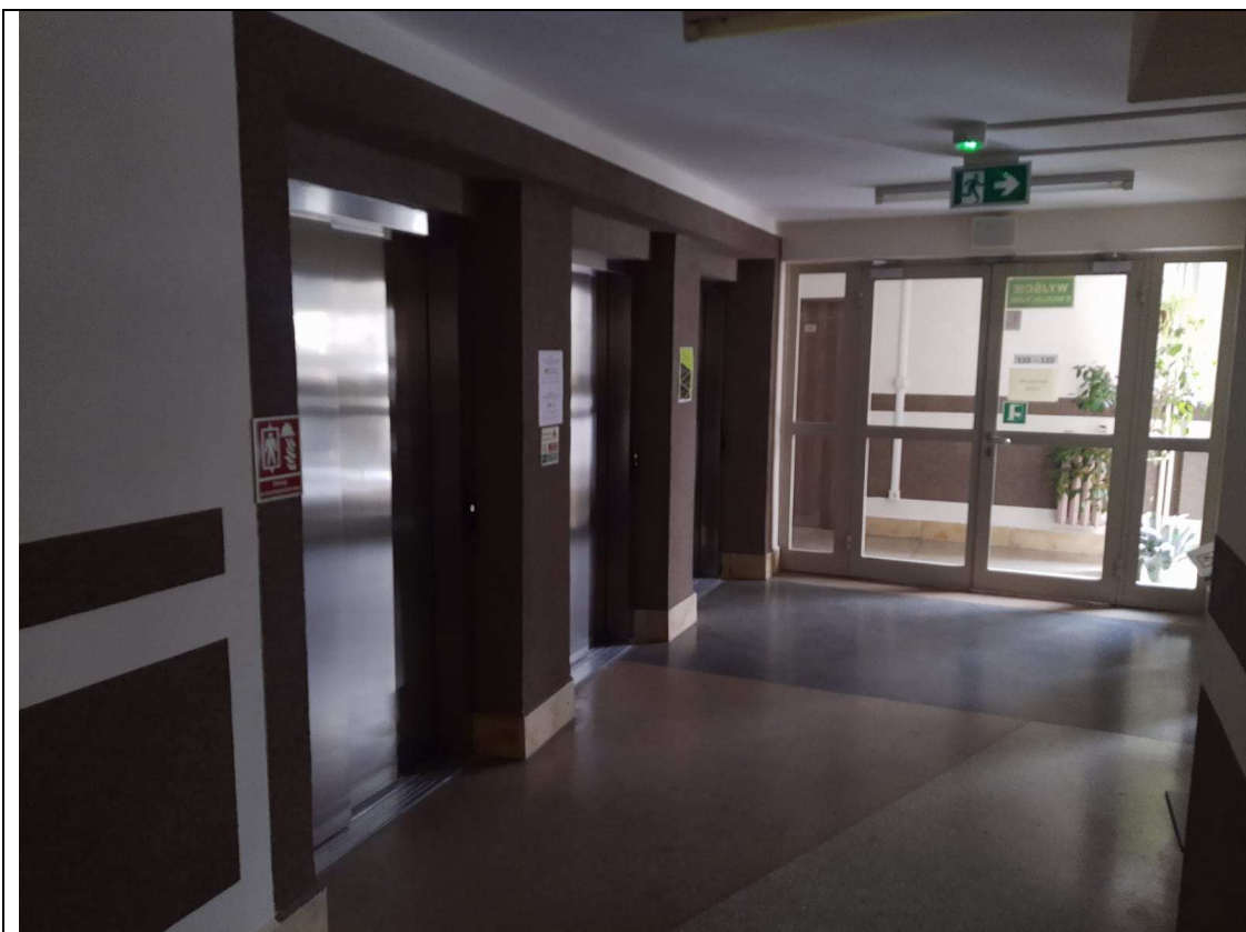
Zdjęcie nr 1 – Hol przed windami