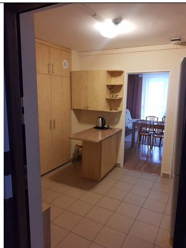
Zdjęcie nr 4 – przedpokój jednego z segmentów