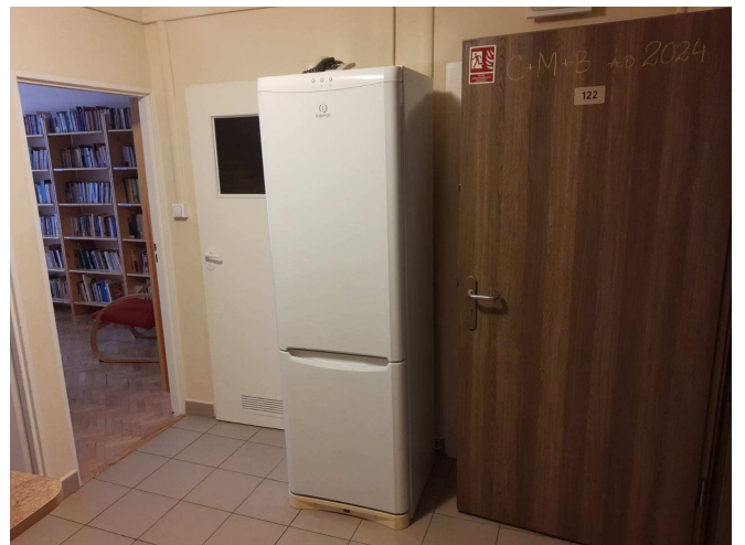
Zdjęcie nr 10 – widok przedpokoju jednego z segmentów