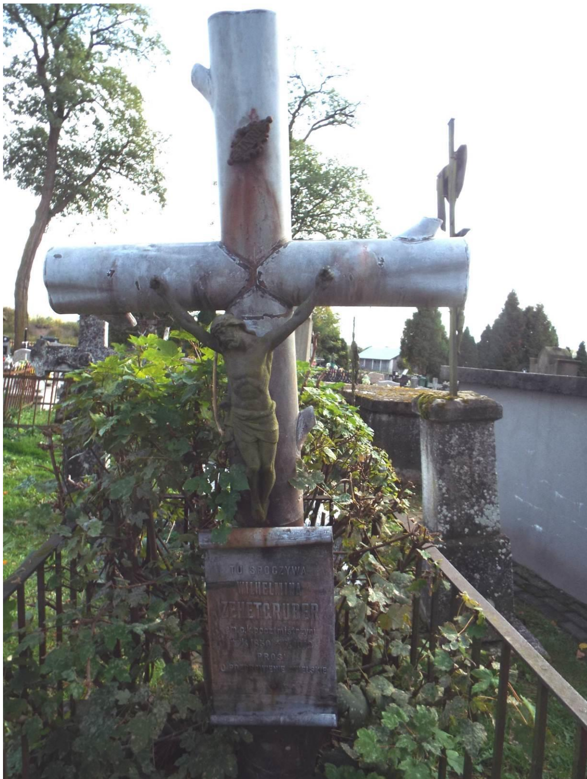
Stary Dzików, cmentarz komunalny, nagrobek Wilhelminy Zehetgruber, 2023 r.