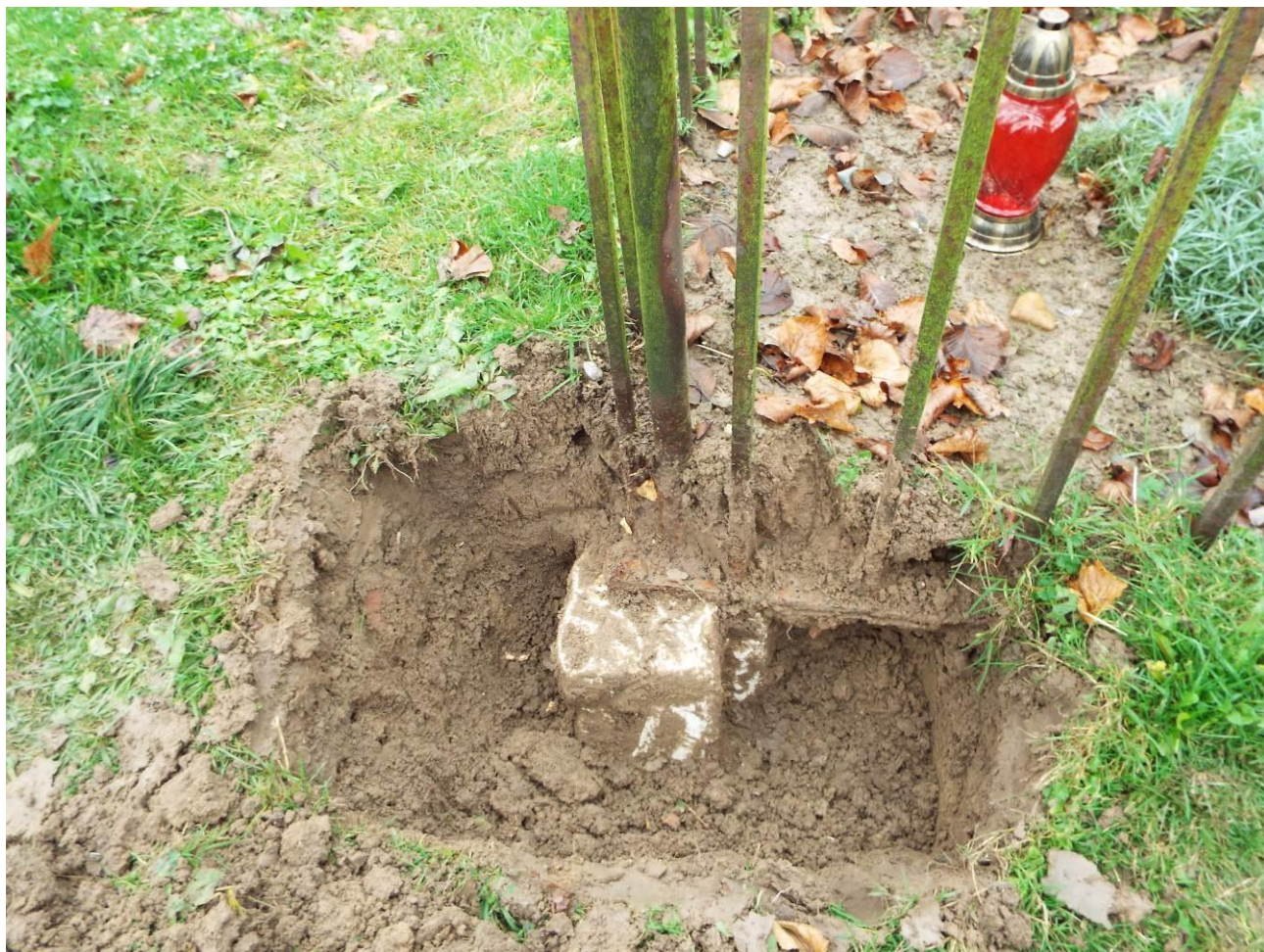
Stary Dzików, cmentarz komunalny, nagrobek Wilhelminy Zehetgruber, sposób montażu ogrodzenia, 2023 r.