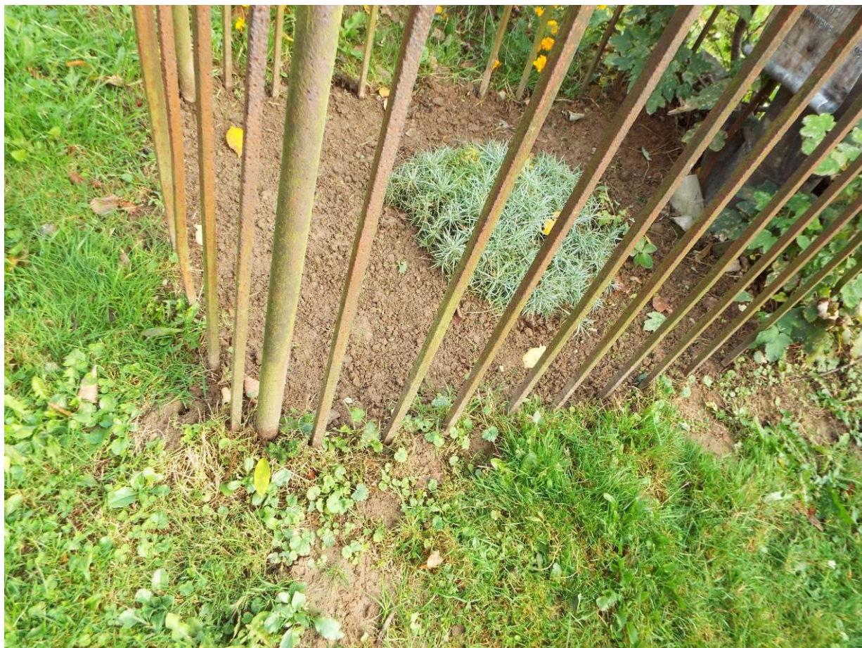
Stary Dzików, cmentarz komunalny, nagrobek Wilhelminy Zehetgruber, 2023 r.