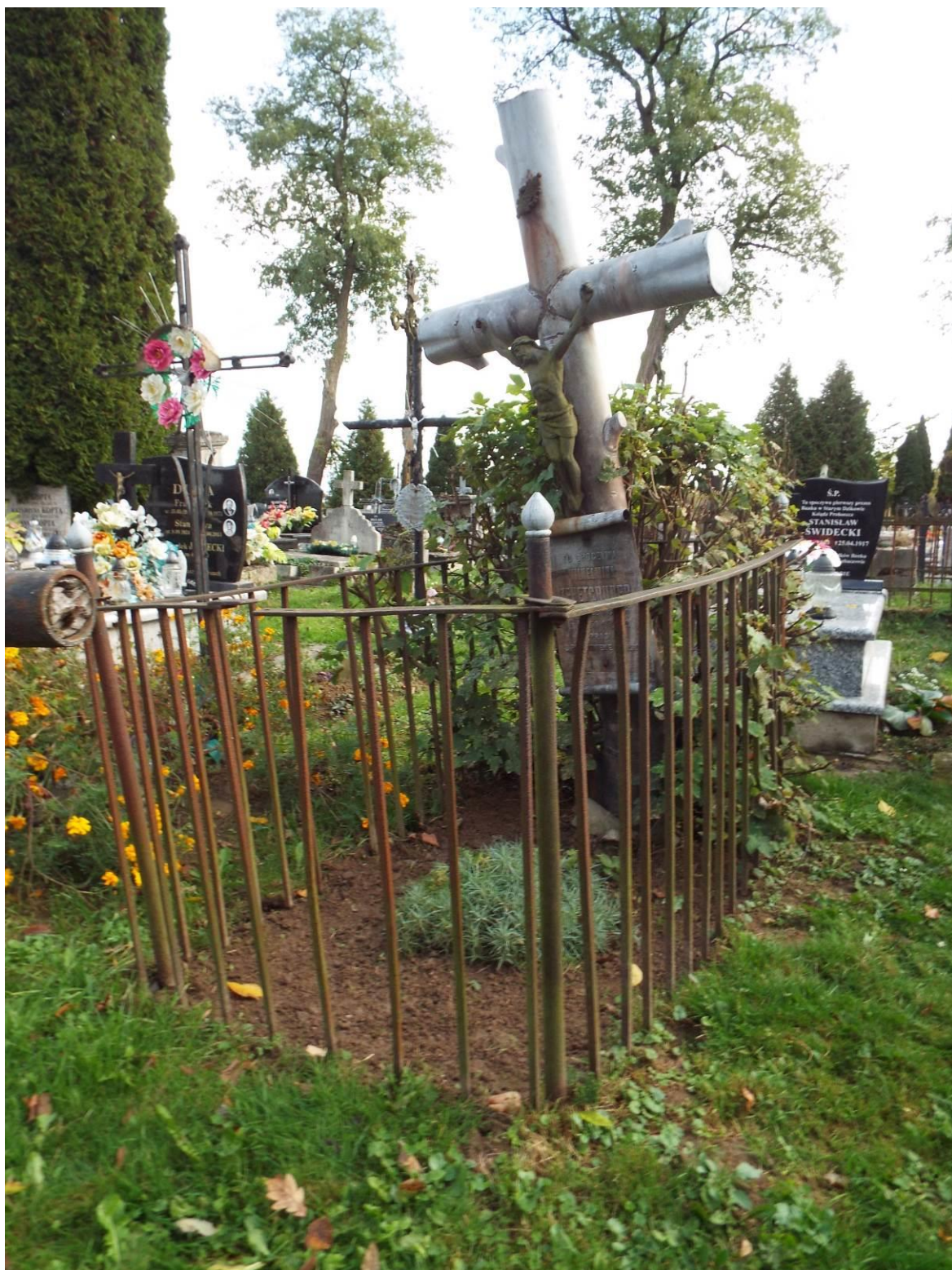
Stary Dzików, cmentarz komunalny, nagrobek Wilhelminy Zehetgruber, 2023 r.