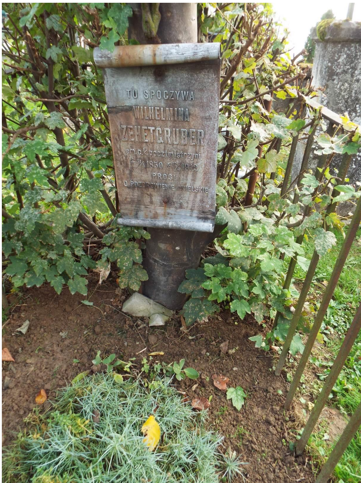
Stary Dzików, cmentarz komunalny, nagrobek Wilhelminy Zehetgruber, 2023 r., fot. B. Woch