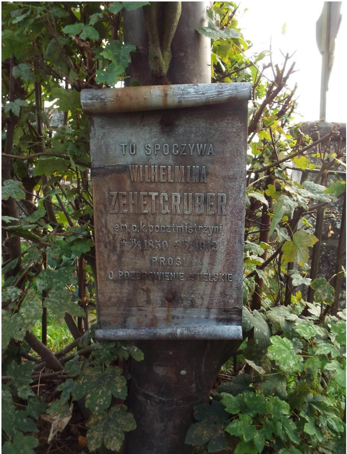
Stary Dzików, cmentarz komunalny, nagrobek Wilhelminy Zehetgruber, 2023 r.