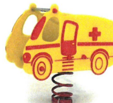
Bujak straż pożarna, policja i ambulans- zdjęcie poglądowe