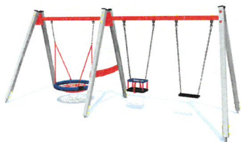
Huśtawka potrójna- zdjęcie poglądowe