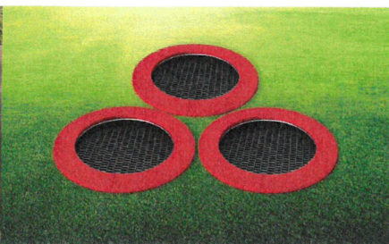
Karuzela bieżniowa oraz trampolina w ziemi- zdjęcia poglądowe