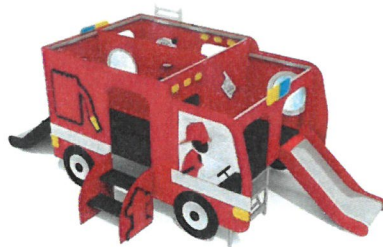
Zjeżdżalnia- zdjęcie poglądowe