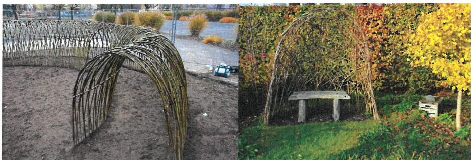
Przykładowa wizualizacja elementów żywej architektury

Załącznik nr 1- Wypis z MPZG Gminy Pruszcz Gdański