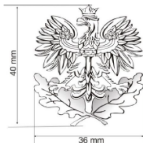
łoczenie dwustronne w metalu