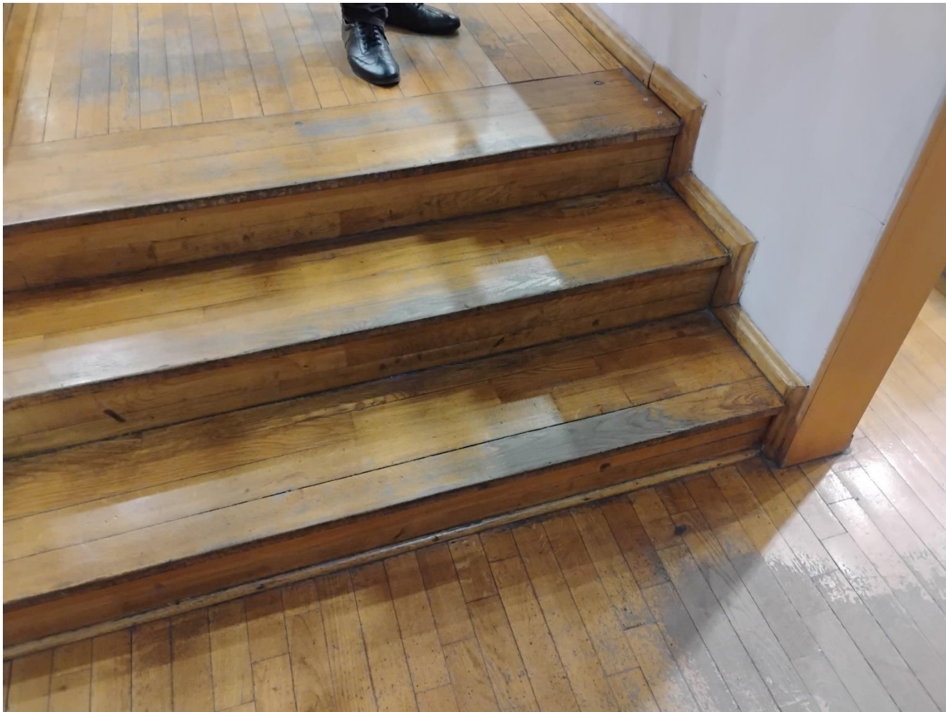
Elementy podłogi przeznaczone do cyklinowania.