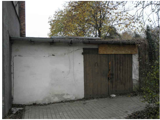
ELEWACJA WSCHODNIA (bud. nr ewid. 39)