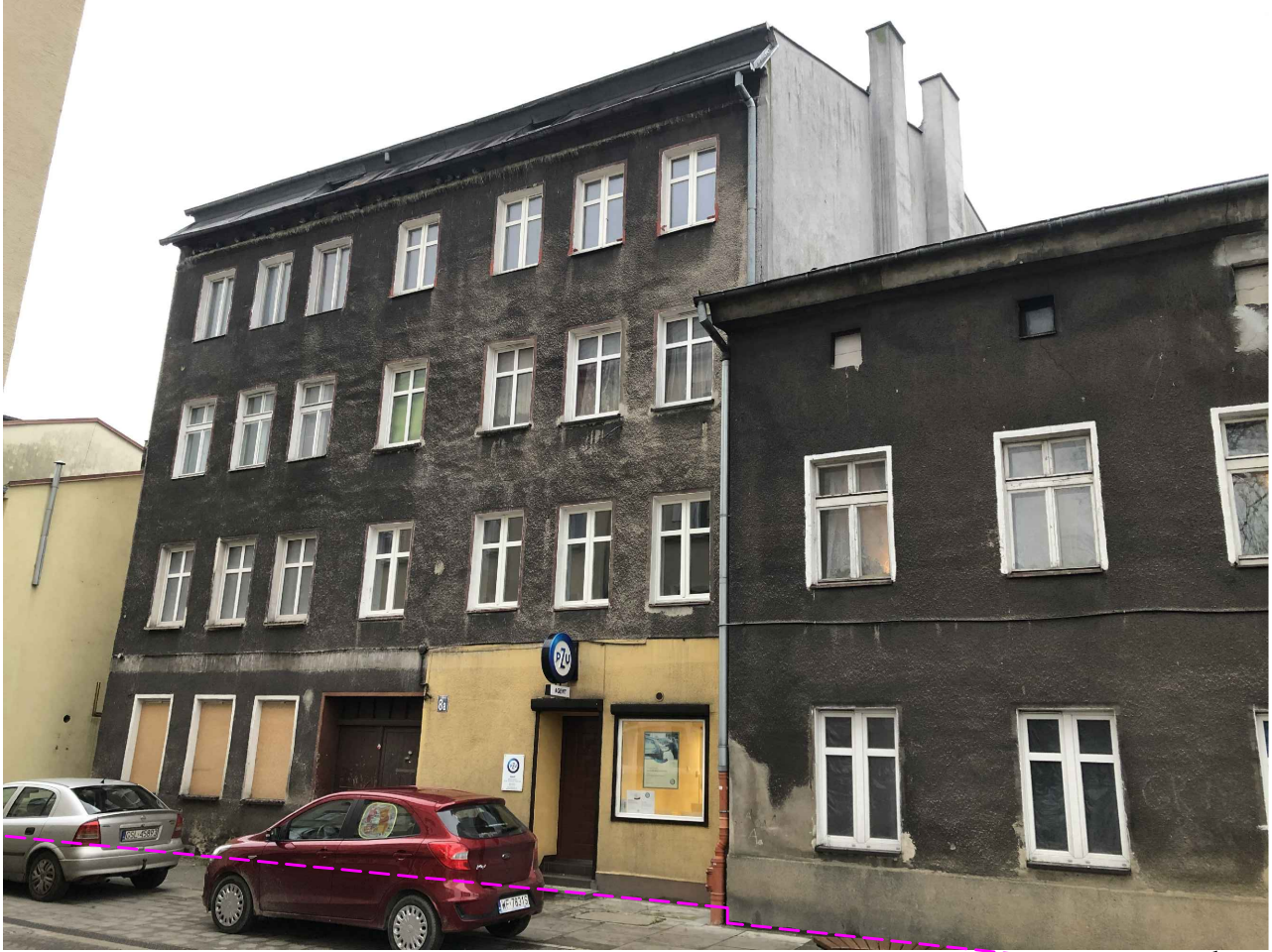
ELEWACJA FRONTOWA WSCHODNIA (bud. nr 973)