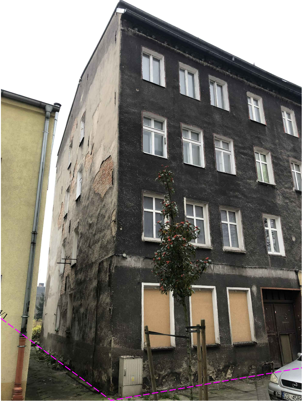
ELEWACJA SZCZYTOWA POŁUDNIOWA (bud. nr 973)

ZAKRES OPRACOWANIA nr ewid. budynku 975 i 974 (rys. nr 7)