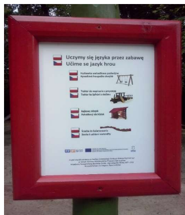
Zdjęcie nr 26