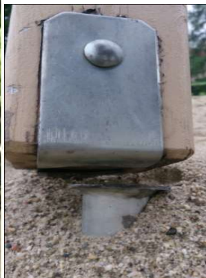
Zdjęcie nr 16