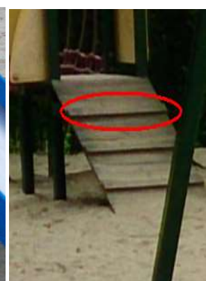
Zdjęcie nr 19