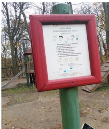
Zdjęcie nr 24