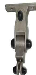
Zdjęcie nr 23