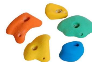
Zdjęcie nr 11