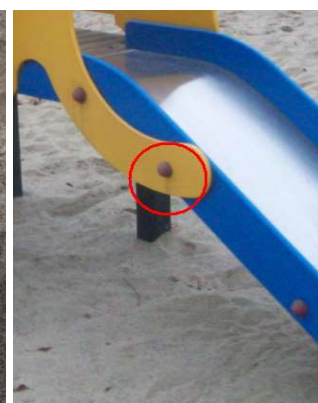
zdjęcie nr 18