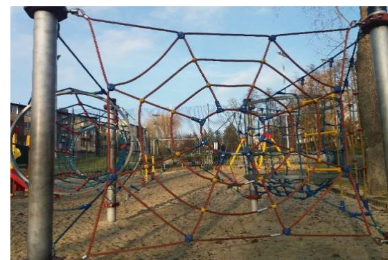
Zdjęcie nr 14