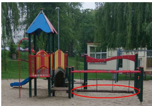
Zdjęcie nr 9