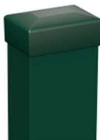
Zdjęcie nr 29