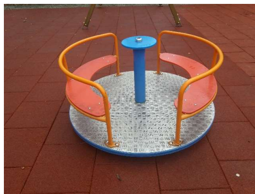
Zdjęcie nr 13