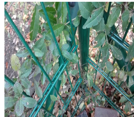
Zdjęcie nr 27