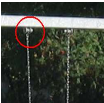
Zdjęcie nr 20