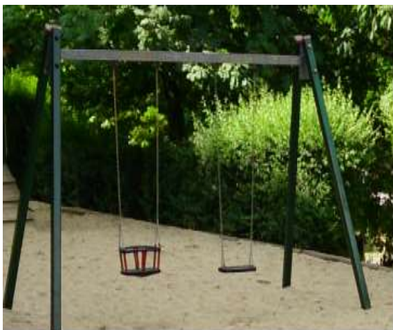
Zdjęcie nr 15