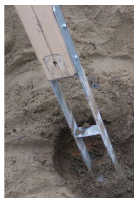
Zdjęcie nr 17