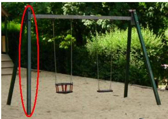
Zdjęcie nr 12