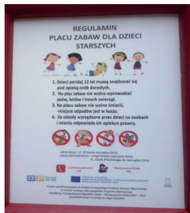
Zdjęcie nr 25