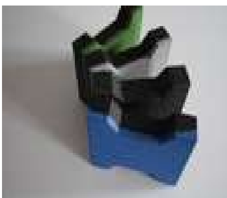
Zdjęcie nr 21