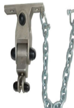
Zdjęcie nr 22