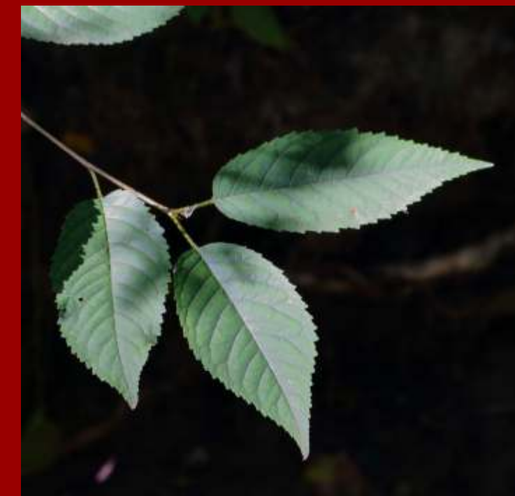
Czereśnia ptasia - liście piłkowane, gruczołki u nasady ogonka, owoce nieco mniejsze od odm. ogrodowych