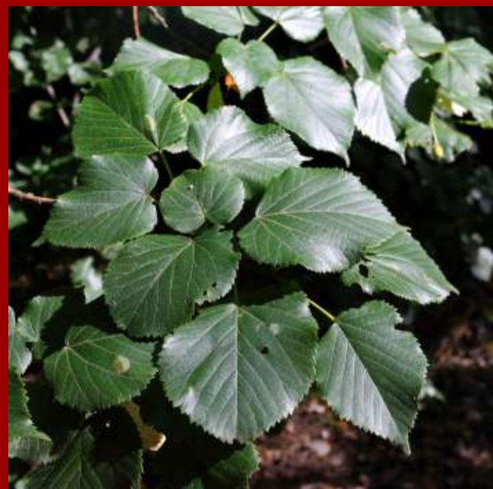
Lipa szerokolistna - liście miętko owłosione, - od spodu, w kąciakach nerwów kępki białych włosków