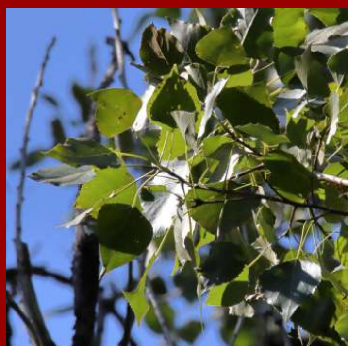
Topola włoska - korona wysmukła - liście przy ogonku klinowate, - odmiana uprawna