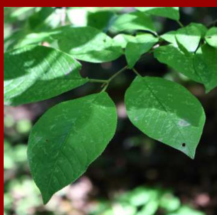
Czeremcha pospolita - drzewo rodzime rosnące nad wodami, - nieprzyjemny zapach, liście matowe, - owoce zjadane przez ptaki