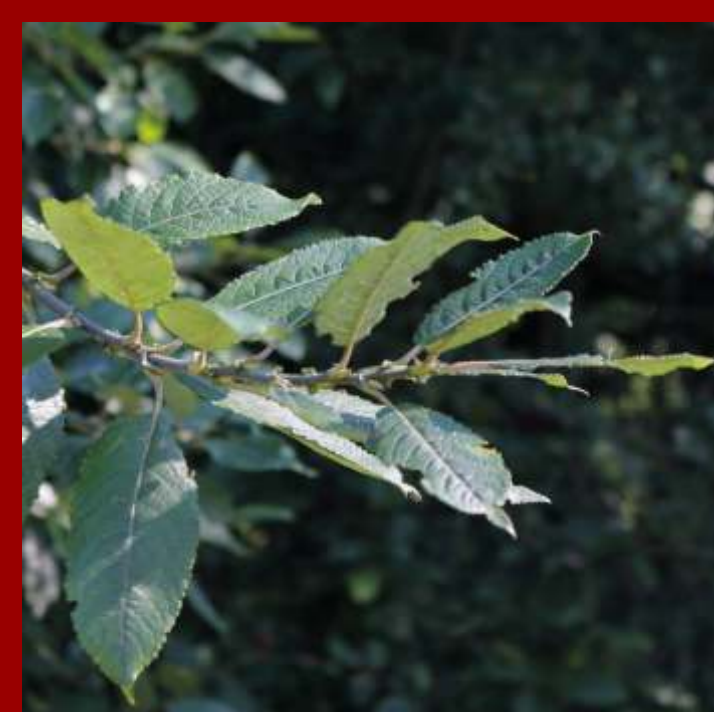
Wierzba iwa - niewielkie drzewo rodzime, - liście brązowane, pomarszczone, zwykle pogięte