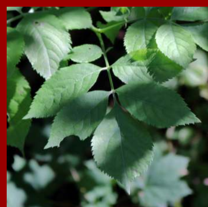
Bez czarny - krzew o liściach złożonych z 5-7 listków, - owoce jadalne, zjadane przez ptaki, - roślina rodzima