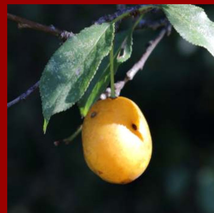
Śliwa wiśniowa - kwitnie wcześniej na biało lub różowo, - owoce żółte z kwiatów białych i czerwone z kwiatów różowych