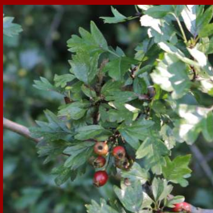
Głóg jednoszyjkowy - liście okrągłe, kłapowane, - jeden słupek w kwiecie i jedna pestka, - kwitnie na biało