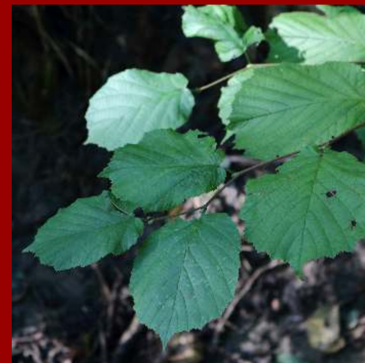
Leszczyna pospolita - liście szerokoeliptyczne, szorstko owłosione, - wielopienny krzew