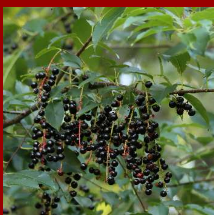
Czeremcha późna - liście błyszczące, owalno lancetowate, - jesienią przebarwia się na pomarańczowo, - obce drzewo inwazyjne