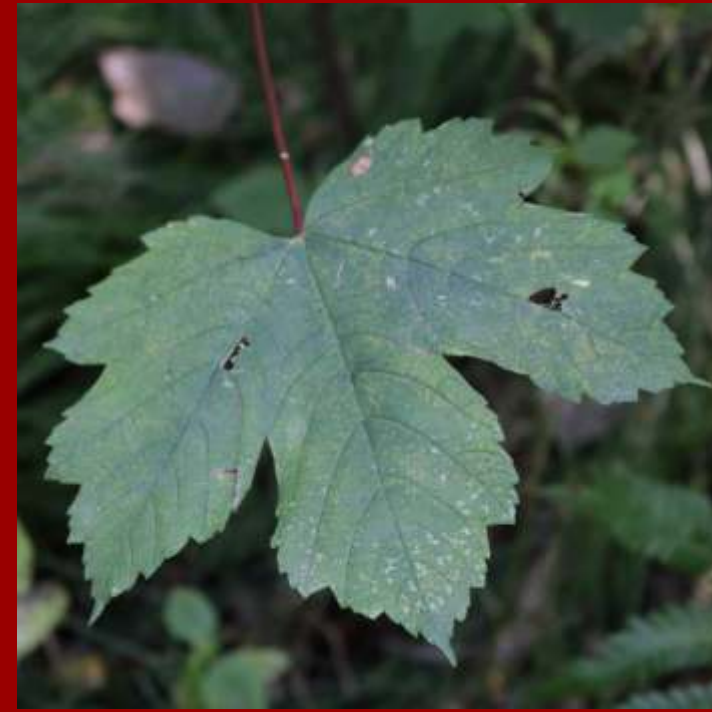
Klon jawor - kłapy wypukłe, - pączki na pędach zielone, - u starszych okazów łuszcząca się kora