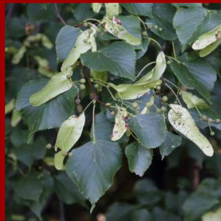
Lipa krymska - liście ciemne, błyszczące, od strony ogonka równo ścięte