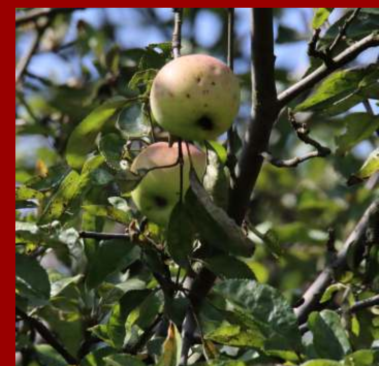
Jabłoni domowa - liście o nieregularnych kształtach, - pnie o spękanej korze, - owoce to ważny pokarm dla zwierząt