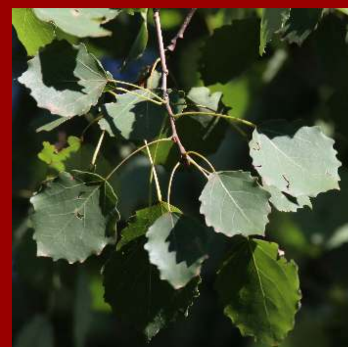
Topola osika - liście okrągłe, zatokowo wrębne, drżące na wietrze, - gatunek rodzimy