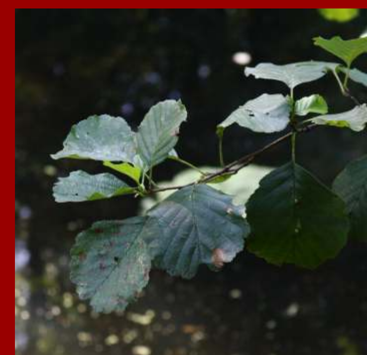
Olsza czarna - liście okrągłe, na szczycie wcięte, - rośnie zwykle w pobliżu wody, - gatunek rodzimy