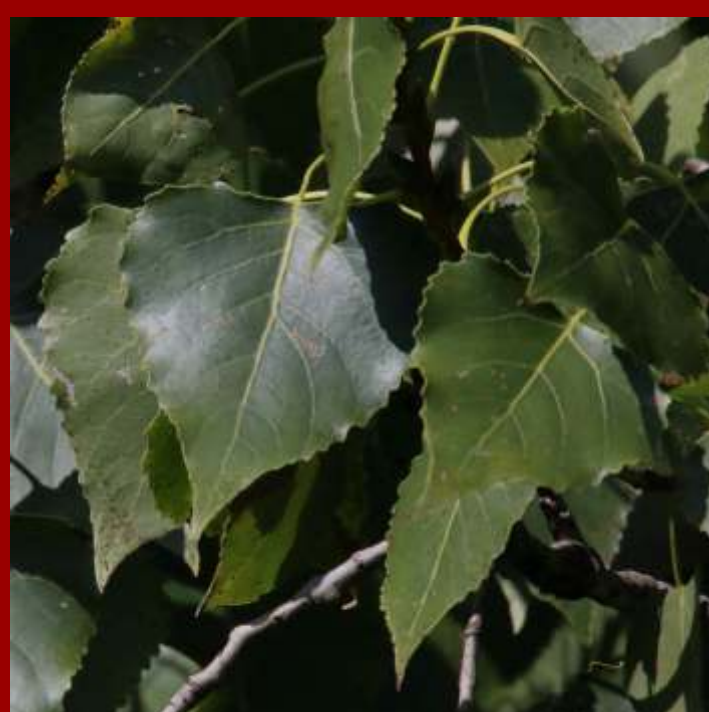
Topola bujna - liście przy ogonku poziomo ścięte lub lekko wypukłe, - szybko rosnąca odm. uprawna