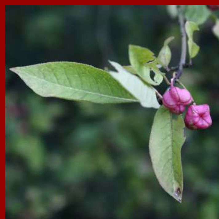
Trzmielina pospolita - krzew o liściach podłużnych, - charakterystyczne owoce z pomarańczowymi nasionami