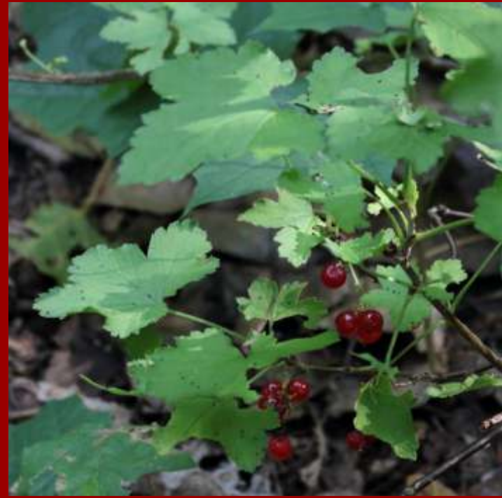
Porzeczka czerwona - krzew do 1,5m, - roślina rodzima, uprawiana często w ogrodach