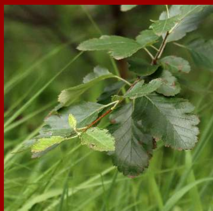
Jarząb szwedzki - liście tępokłapowane, od spodu miętko owłosione, - ma stanowiska naturalne na Pomorzu