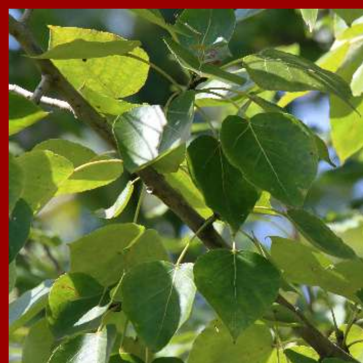
Topola późna - liście przy ogonku sercowate, - szybko rosnąca odmiana uprawna