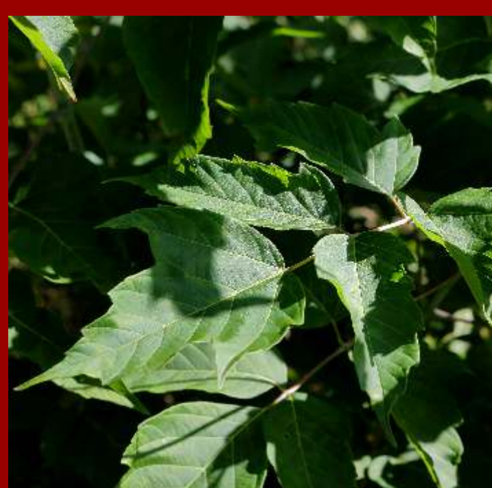
Klon jesionolistny - liście złożone z 5-7 listków, - pędy zielone, młode srebrzyste, - obca roślina inwazyjna