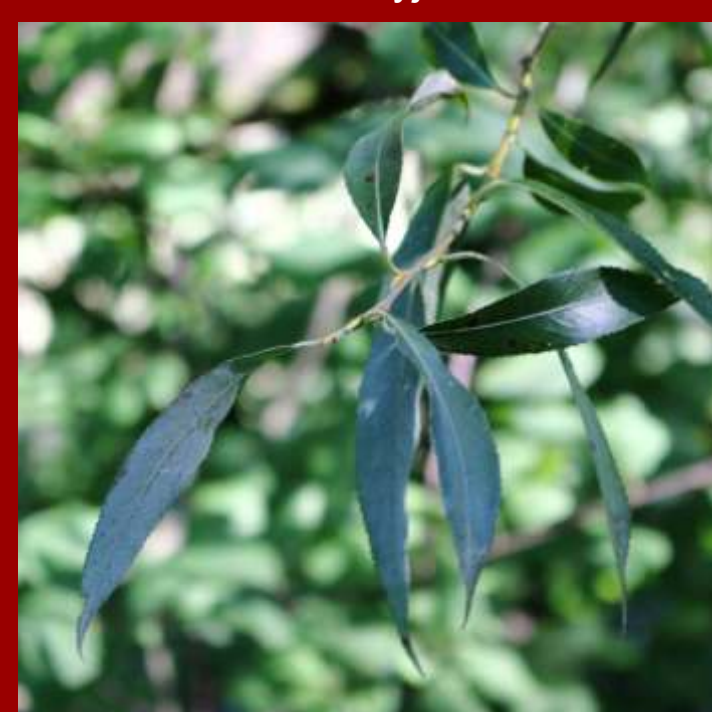
Wierzba biała - liście lancetowate, spodem białawe, - u młodych listków drobno owłosione, - drzewo rodzime rosnące nad wodami