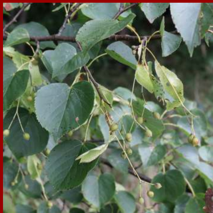
Lipa drobnolistna - liście nagie, sercowate, - od spodu, w kąciakach nerwów kępki brązowych włosków