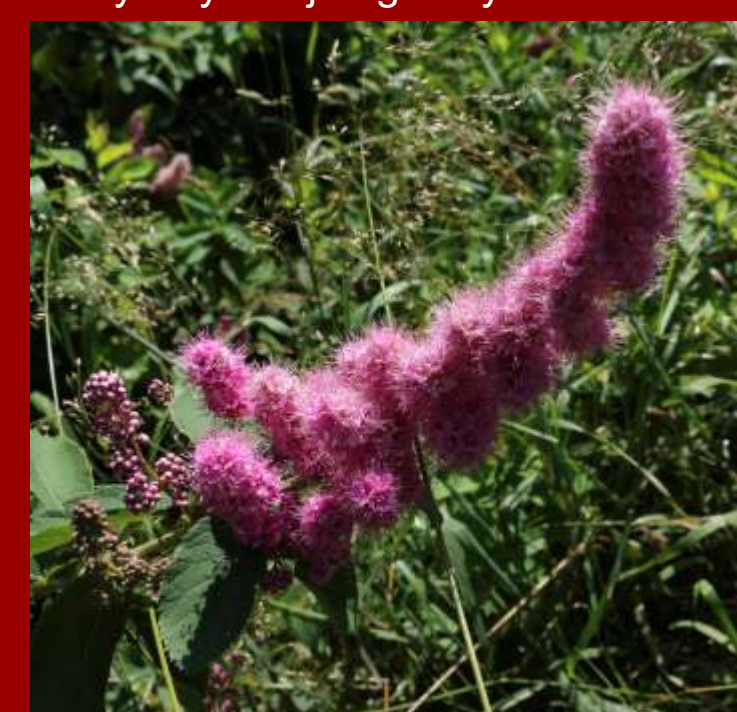
Tawuła nibywierzbolistna - liście podługowate, spodem prawie nagie, - kwiatostany piramidalne, różowe, - krzew ozdobny pochodzący z Ameryki Pn.