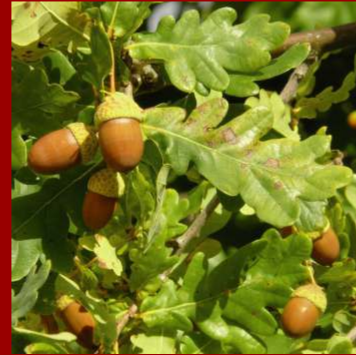
Dąb szypułkowy - kłapy obłe, liście nieregularne - żołędzie z ogonkami, wydłużone i wyraźnie wystające z miseczek