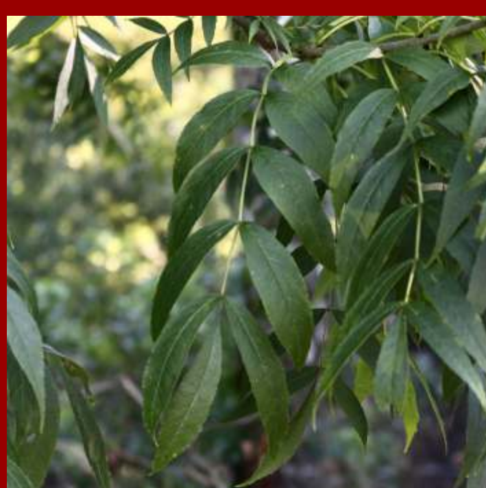
Jesion wyniosły - liście złożone z lancetowatych listków, jesienią zwykle opadają zielone, - drzewo rodzime