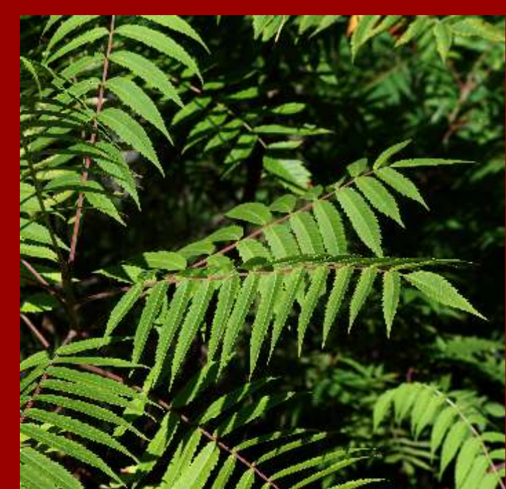
Sumak octowiec - krzew o liściach pierzasto złożonych, - pięknie przebarwia się jesienią, - dotyk wywołuje egzemy