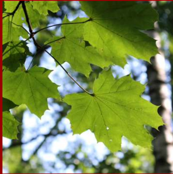
Klon pospolity - kłapy wklęsłe, - pączki na pędach czerwone