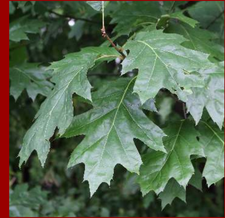
Dąb czerwony - kłapy wklęsłe, zaostrome, - żołędzie kuliste, miseczki spłaszczone, - obca roślina inwazyjna