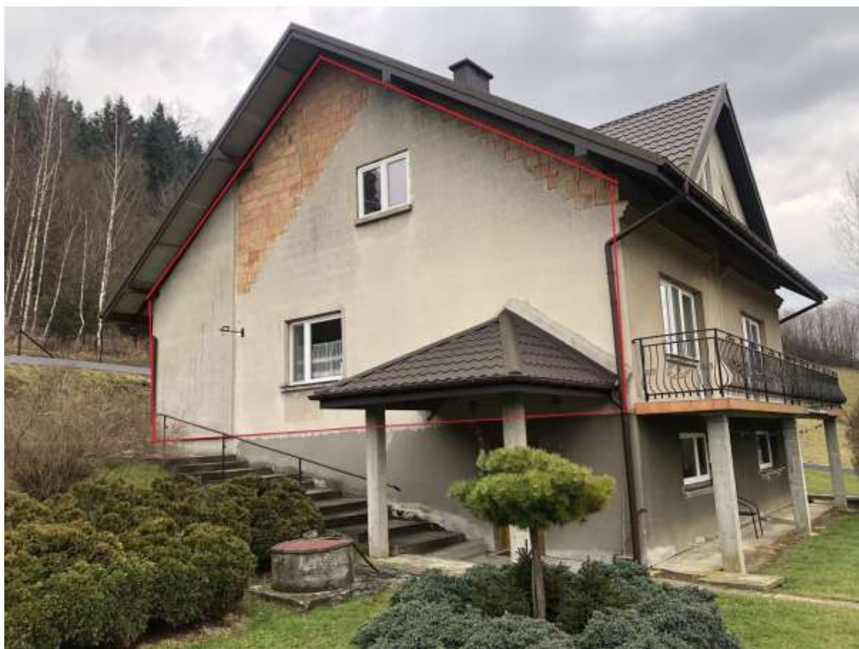
Rysunek 1 Zakres modernizacji - docieplenie ściany zewnętrznej (elewacja północna)