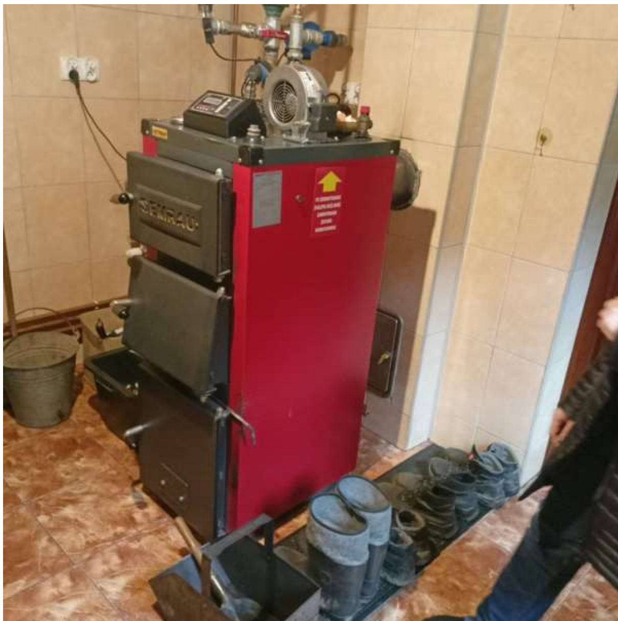
Rysunek 4 Zakres modernizacji - wymiana źródła ciepła wraz z modernizacją instalacji ciepła co i cwu