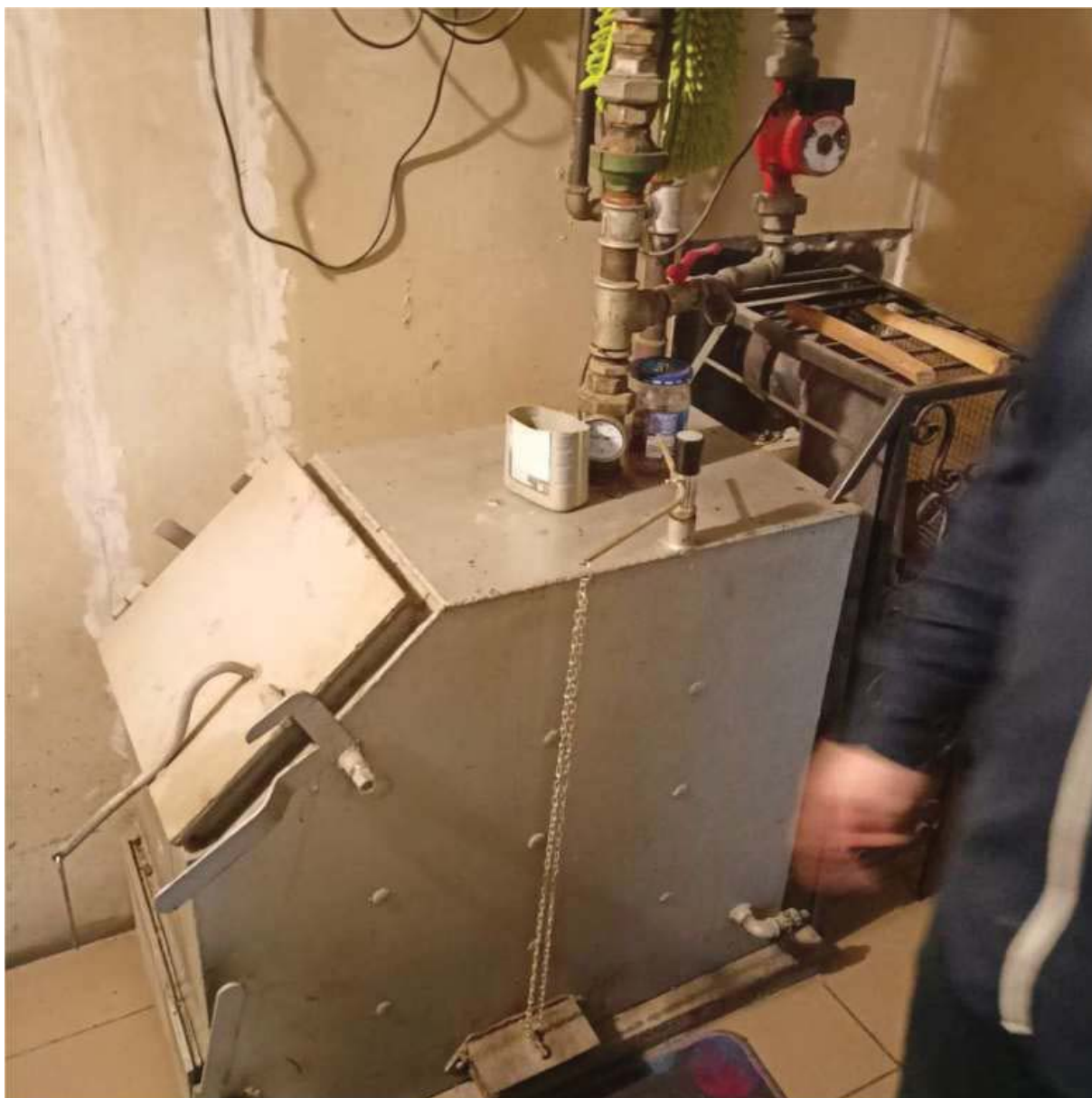
Rysunek 6 Zakres modernizacji – Wymiana źródła ciepła wraz z modernizacją instalacji w kotłowni