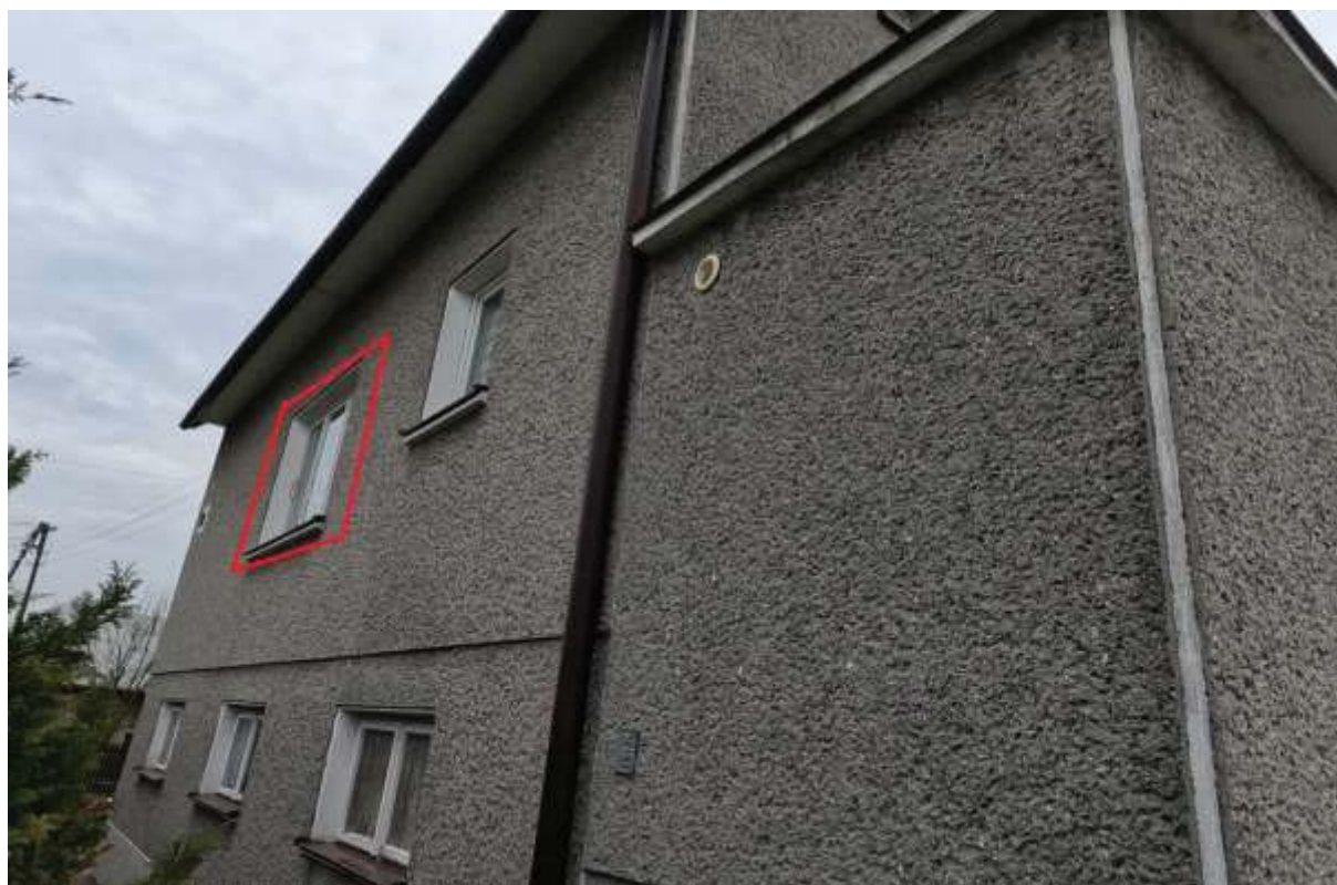
Rysunek 2 Zakres modernizacji – Wymiana okien elewacja północna