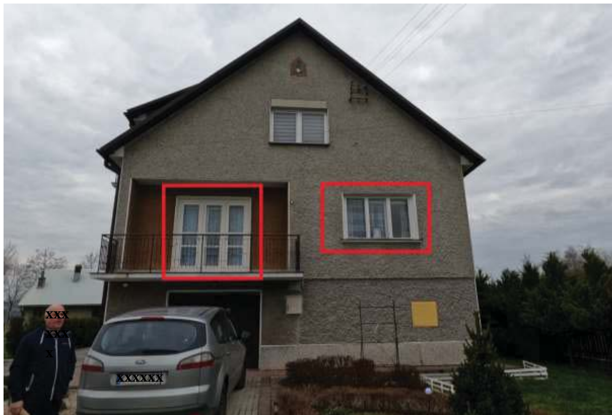
Rysunek 1 Zakres modernizacji – Wymiana okien elewacja wschodnia