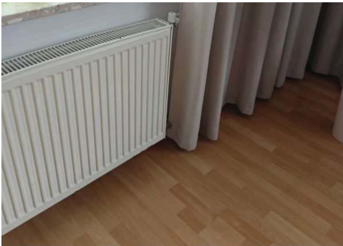
Rysunek 4 Zakres modernizacji – Montaż zaworów termostatycznych