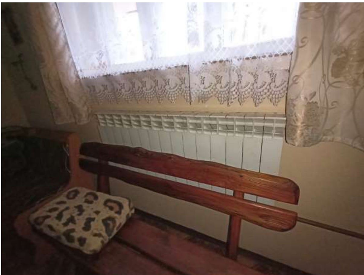
Rysunek 5 Modernizacja instalacji co - stan obecny