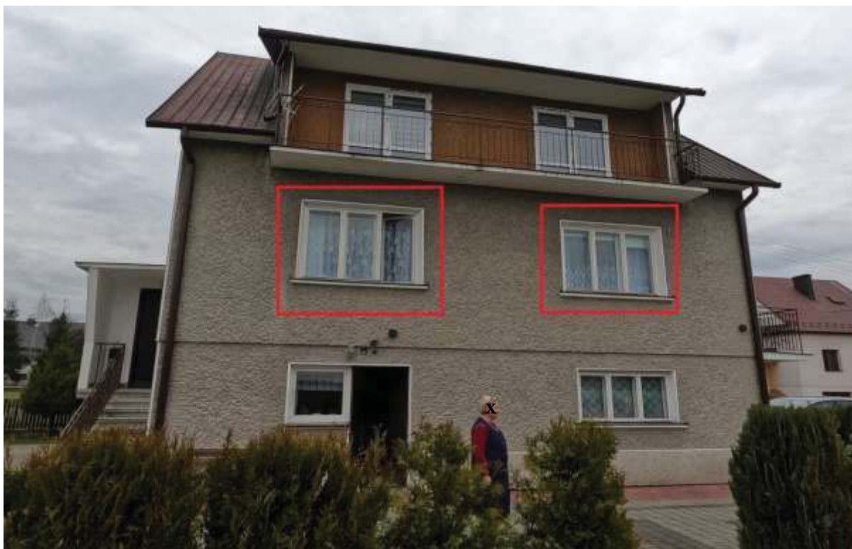
Rysunek 3 Zakres modernizacji – Wymiana okien elewacja południowa