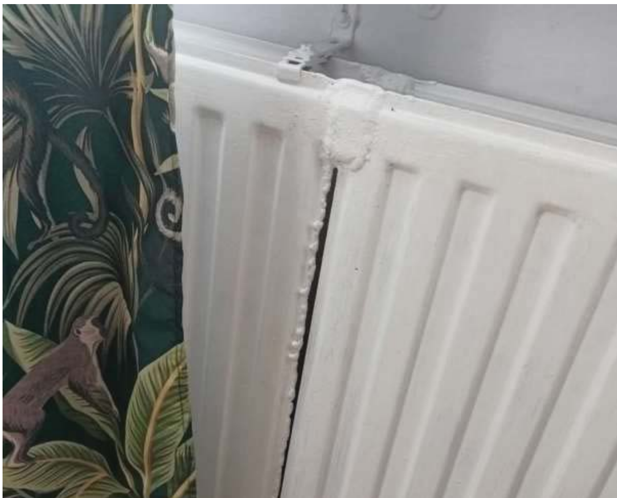
Rysunek 5 Zakres modernizacji – Wymiana grzejników