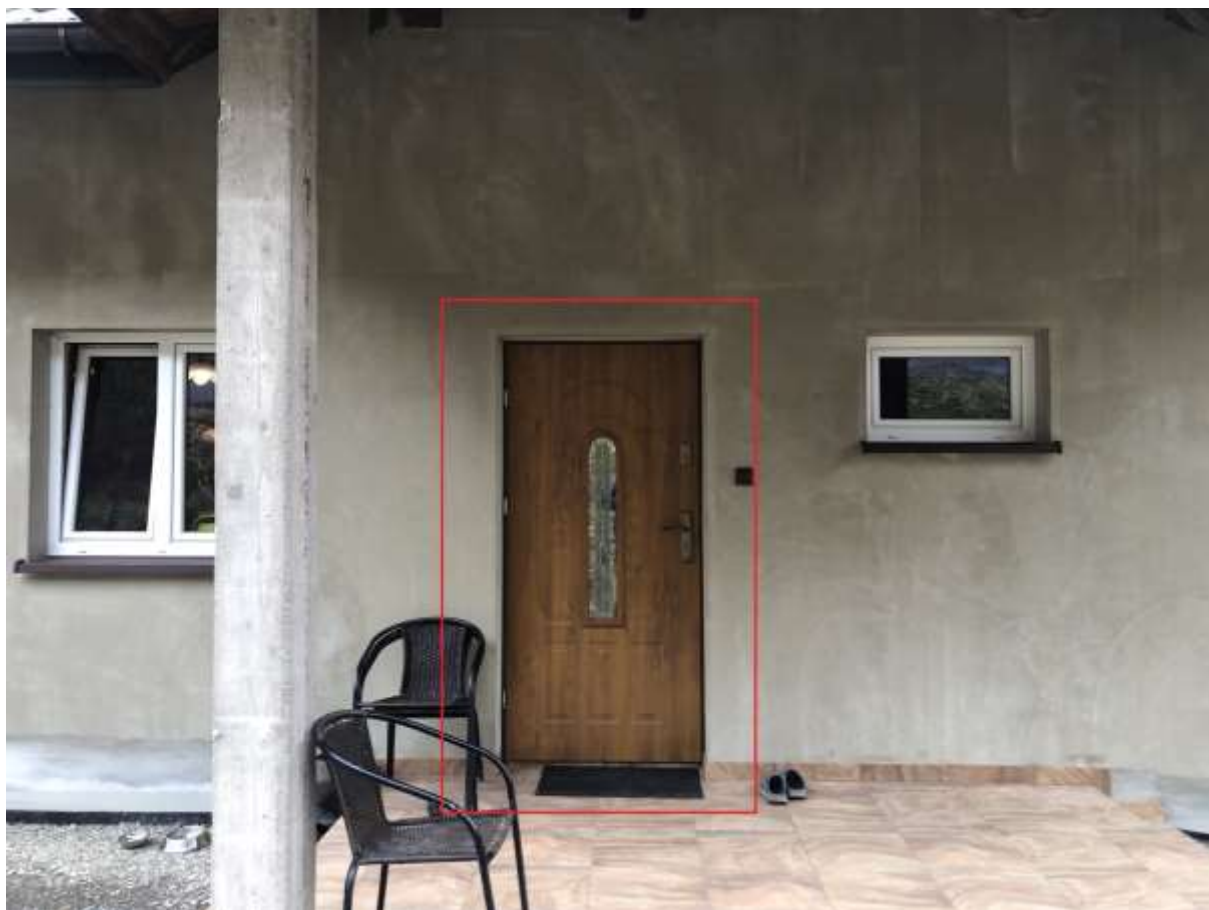
Rysunek 2 Zakres modernizacji - wymiana drzwi wewnętrznych