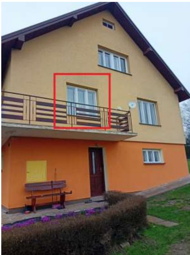
Rysunek 2 Wymiana stolarki okiennej - zakres prac na elewacji wschodniej