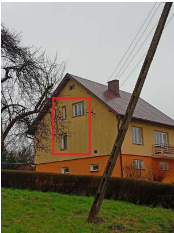
Rysunek 3 Wymiana stolarki okiennej - zakres prac na elewacji zachodniej