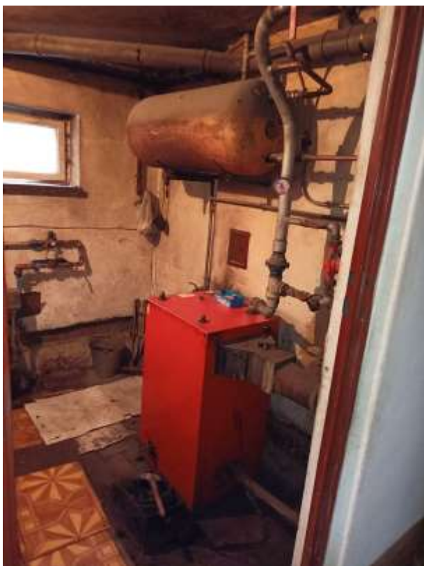
Rysunek 4 Wymiana źródła ciepła - dokumentacja zdjęciowa kotłowni