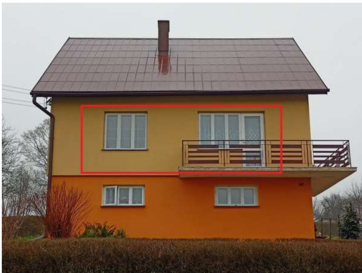
Rysunek 1 Wymiana stolarki okiennej - zakres prac na elewacji południowej