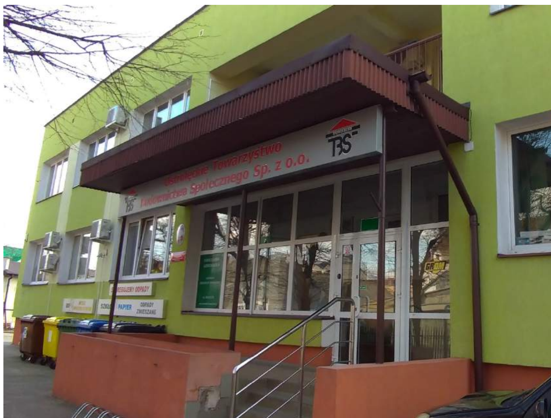
Fot. 1 – Wejście główne - widok