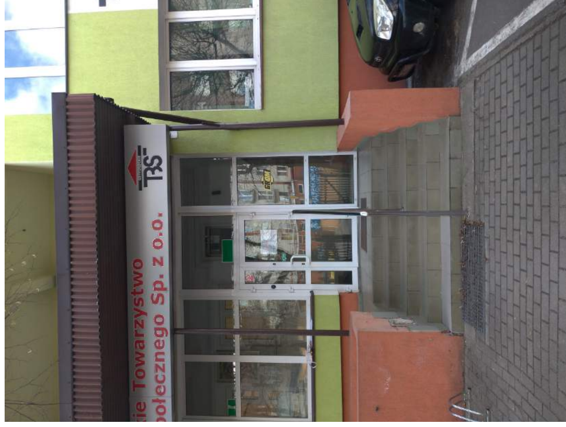
Fot. 3 – Widok na schody zewnętrzne