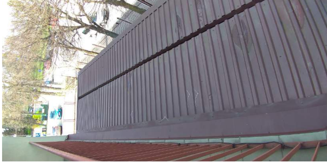
Fot. 7 – Widok na pokrycie zadaszenia wejścia