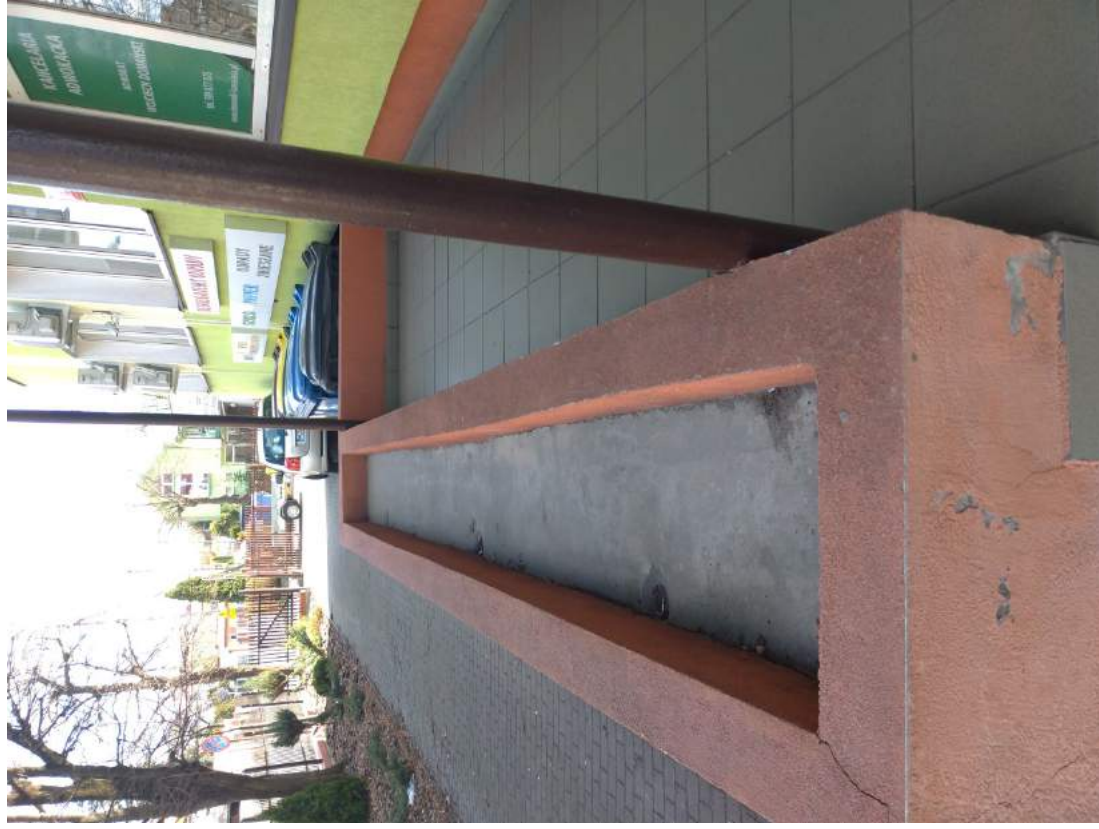
Fot. 4 – Widoczne pęknięcia i ubytki tynku na donicy