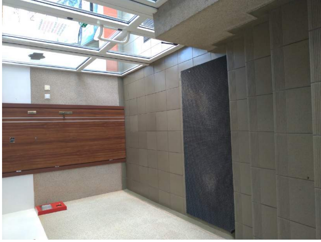
Fot. 8 – Widok wejścia od strony wewnętrznej