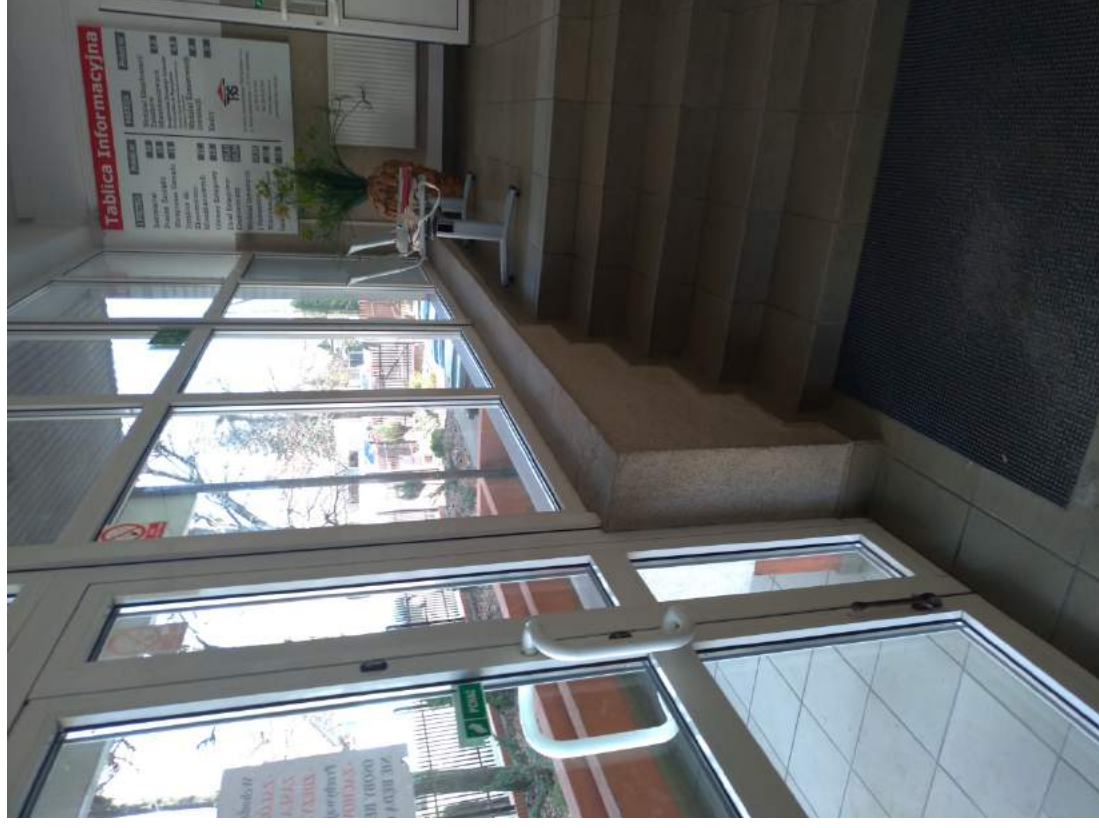
Fot. 9 – Widok witryny od wewnątrz