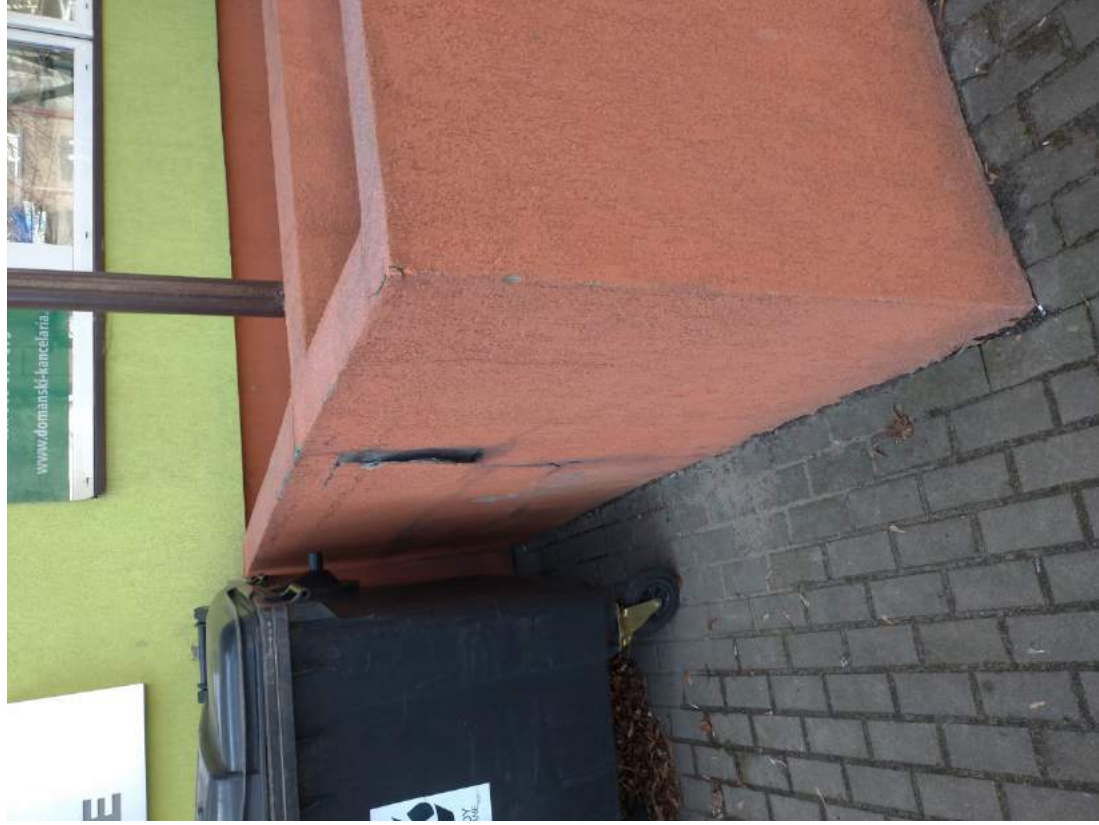
Fot. 6– Widoczne odspojenie tynku na fragmencie ściany wejścia