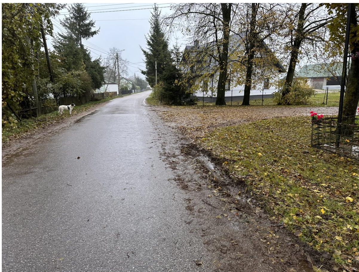
Zdj. 2 Koniec projektowanej trasy