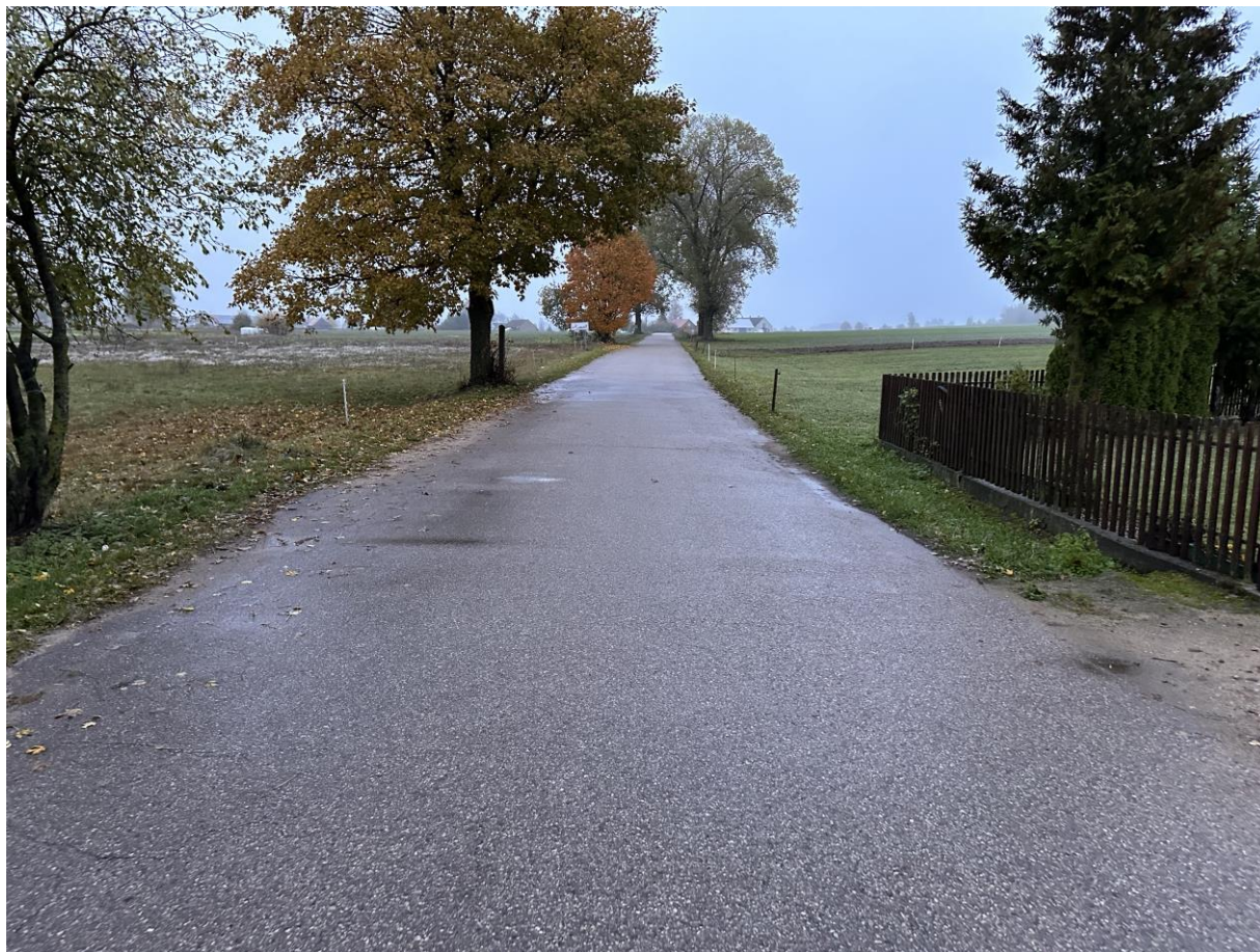
Zdj. 1 Początek projektowanej trasy.