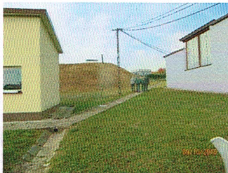
Zagrody Zbiornik 1