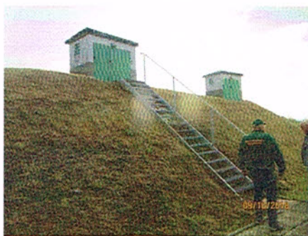
Zagrody Zbiornik 1,2