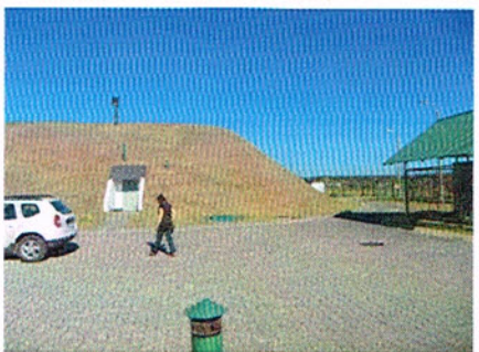
zbiornik Browar widok

Termin realizacji przedmiotu zamówienia: 12.06.2022 - 24.06.2022 z zastrzeżeniem, iż terminy mogą ulec wydłużeniu ze względu na warunki pogodowe, uniemożliwiające wykonanie przedmiotu zamówienia w terminach wskazanych jako termin realizacji. Zmiana terminu nie spowoduje zmiany wynagrodzenia.