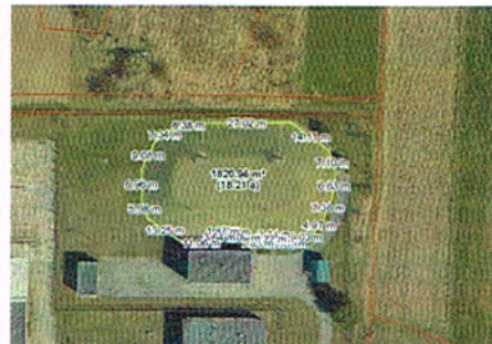
zbiornik Browar obrys