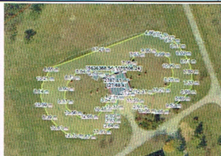
suw zbiornik z obrysem powierzchni