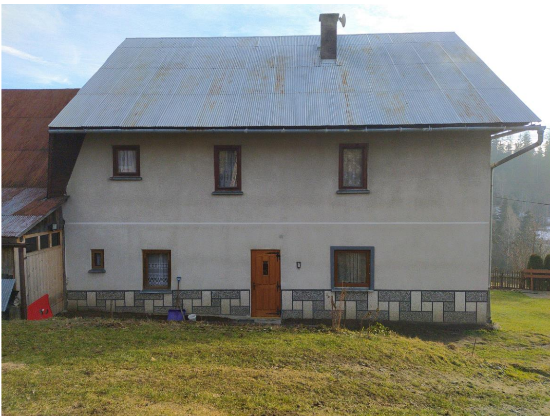
widok od strony NW