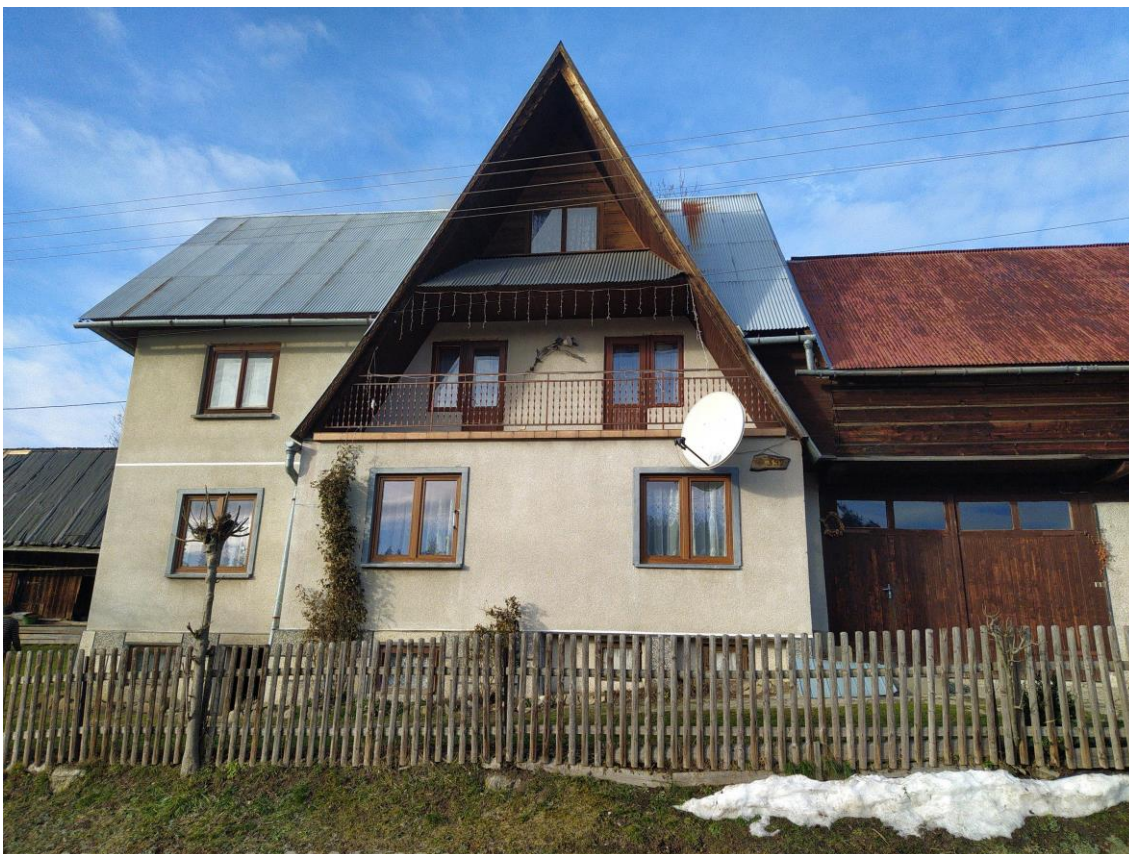
widok od strony SE