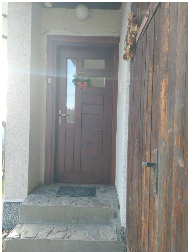
widok od strony NE