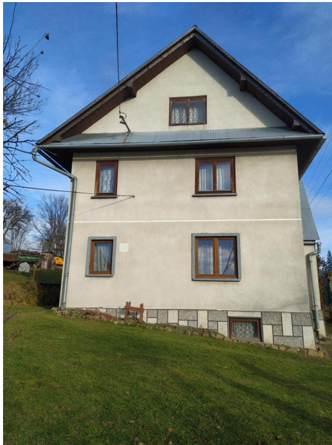
widok od strony SW